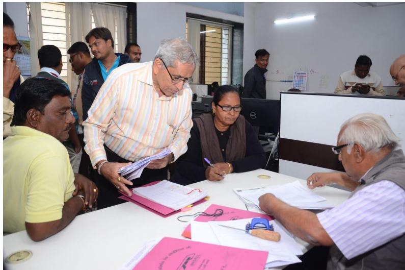
વડોદરા ખાતે જમીન સંપાદન સંમતિ શિબિરનું આયોજન.

પ્રોજેક્ટની અસરની આકારણી કરવા અને પ્રોજેક્ટ અસરગ્રસ્તો (પી.એ.પી.) ને વળતર મેળવવા, આર એન્ડ આર સહાયકો તેમજ તેમના સામાજિક વિકાસ માટેના અન્ય પગલાઓની સહાય માટેના ઘટાડાનાં પગલાં વિકસાવવા પ્રોજેક્ટ માટે આદિજાતિ લોકોની યોજના (આઈ.પી.પી.) ની સાથે એક આર.એ.પી. વિકસાવવામાં આવી છે. આર્થિક ધોરણો અને આજીવિકા ક્ષમતા. પ્રોજેક્ટ માટે દરખાસ્ત કરેલી આવક પુનઃસંગ્રહ યોજનાનો હેતુ પ્રોજેક્ટ અસરગ્રસ્ત પરિવારો (પીએએચએસ) ની આવક વિકસિત કરવાનો છે જેનો પ્રોજેક્ટ અને પ્રોજેક્ટ સ્તર પહેલાં અથવા વધુ સારું થઈ શકે છે, અને પીએએચએસના પુનર્વસન માટેનો એક મહત્વપૂર્ણ ભાગ છે. પીએએચએસને તેમની હાલની પ્રવૃત્તિઓ અને કુશળતાનો લાભ આપવા માટે રચાયેલ વિવિધ વિકલ્પોમાંથી પસંદગી કરવાની તક મળશે. બધા પી.એ.પી. ઉપલબ્ધ વિકલ્પો વિશે સારી રીતે માહિતગાર છે અને તેમાં ભાગ લેવા માટે પૂરતી તક આપવામાં આવે છે તેની ખાતરી કરવા માટે વિસ્તૃત જોડાણ હાથ ધરવામાં આવશે.