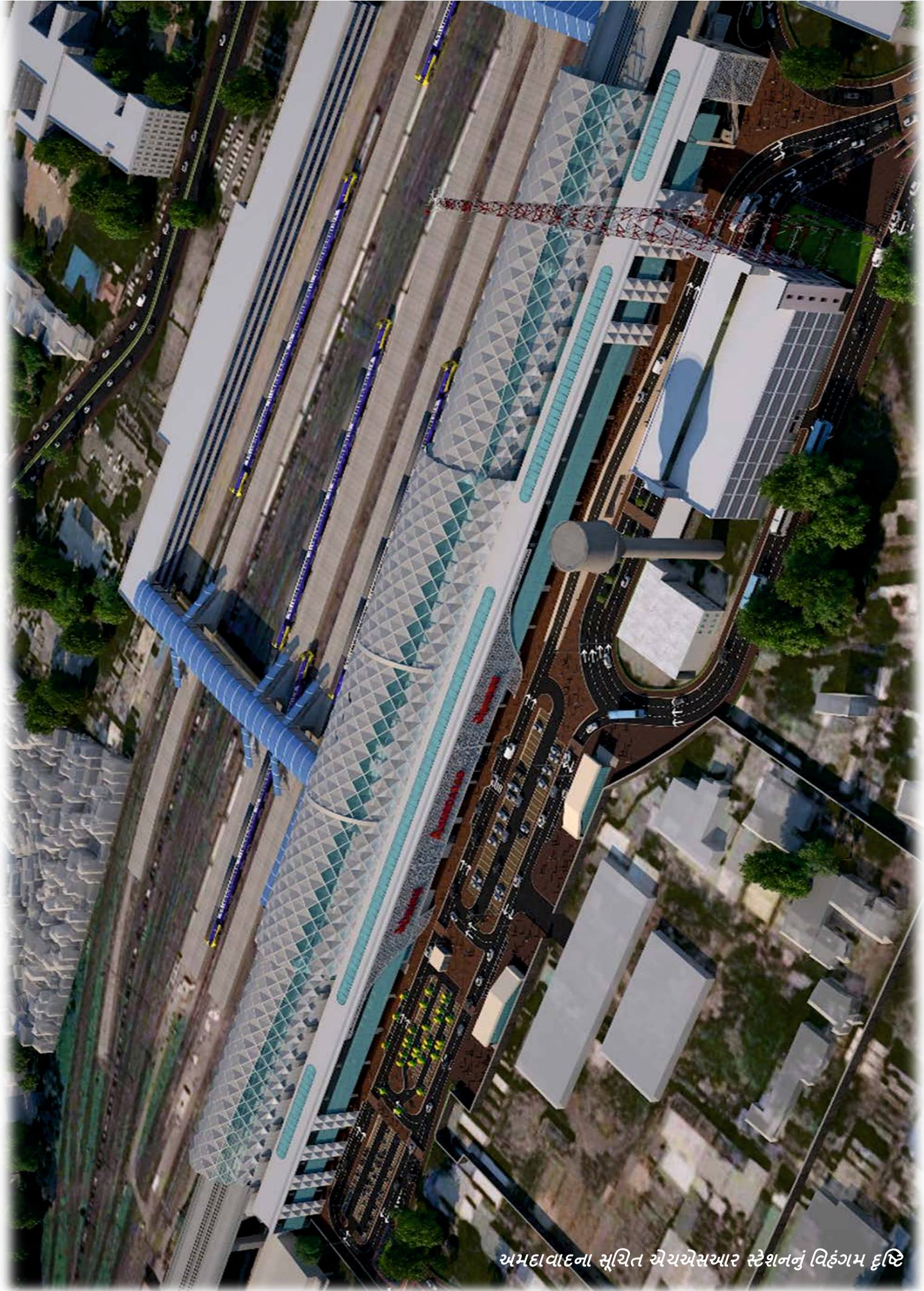
અમદાવાદના સૂચિત એચએસઆર સ્ટેશનનું વિહંગમ દૃષ્ટિ