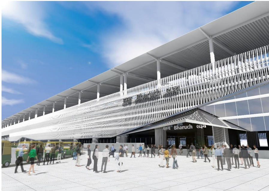
ભરૂચ ખાતે સૂચિત એચએસઆર સ્ટેશન

કંપનીએ સી-પ પેકેજના ૮ કિ.મી. પથરેખા માટે કન્સ્ટ્રક્શન મેનેજર જનરલ કોન્ટ્રાક્ટર (સીએમજીસી) ની રજૂઆત કરી છે (વડોદરા વિભાગ માટે સિવિલ વર્ક્સ જ્યાં પથરેખા અડીને છે અને હાલના પશ્ચિમ રેલવે મેઇનલાઇનને પાર કરે છે અને તેમાં વડોદરા સ્ટેશન શામેલ છે) અને સી-૭ ના ૧૮ કિ.મી. (અમદાવાદ અને સાબરમતી વિસ્તાર માટે સિવિલ વર્ક્સ જ્યાં પથરેખા અસ્તિત્વમાં છે તે પશ્ચિમ રેલવે ટ્રેકને અડીને અને તેને પાર કરે છે, અને તેમાં અમદાવાદ અને સાબરમતી સ્ટેશન શામેલ છે), કારણ કે આ પદ્ધતિઓમાં બાંધકામો ટેકનિકલ રીતે પડકારજનક છે. આ બે વિભાગ માટે બાંધકામના કામની જટિલતાને ધ્યાનમાં રાખીને જાપાન ઇન્ટરનેશનલ કોઓપરેશન એજન્સી (જેઆઈસીએ) અને એનએચએસઆરસીએ કન્સ્ટ્રક્શન મેનેજર જનરલ કોન્ટ્રાક્ટર (સીએમજીસી) તરીકે ડિઝાઇન સ્ટેજ પર કોન્ટ્રાક્ટરની નિમણૂક / નિમણૂક માટે સંમતિ આપી છે. આ રચનાના નિર્માણના દૃષ્ટિકોણથી, બાંધકામની યોજના અને પ્રોજેક્ટના ખર્ચથી ડિઝાઇનને મહત્તમ કરવાના દૃષ્ટિકોણથી છે. જેઆઈસીએ અને એનએચએસઆરસીએલ વચ્ચે ૨૪ ઓક્ટોબર, ૨૦૧૭ ના રોજ આ અંગેના એમઓયુ પર હસ્તાક્ષર કરવામાં આવ્યા હતા. આ એમઓયુને આગળ ધપાવીને સીએમજીસીને મે - ૨૦૧૮ માં અમદાવાદ - સાબરમતી (સી -૭ પેકેજ) માટે અને ડિસેમ્બર ૨૦૧૮ માં વડોદરા (સી) માટે નિમણૂક કરવામાં આવી છે. ( સી-પ પેકેજ).