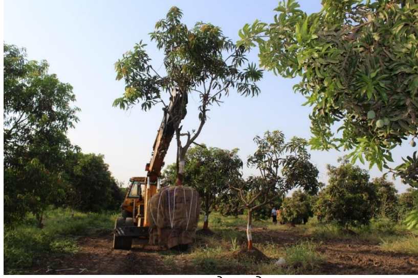
અમદાવાદ સ્થળે વૃક્ષારોપણ.