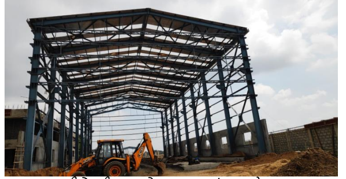
ડીએમસી મુખ્ય શેડ, વટવા (બાંધકામ હેઠળ)