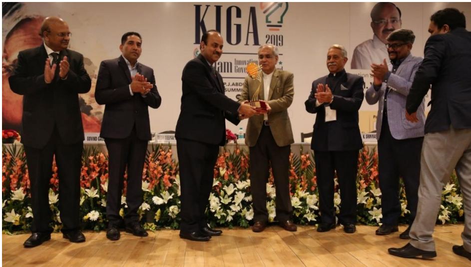
ઇનોવેશન ઇન ગવર્નન્સ માટે કલામ ઇનોવેશન ઇન ગવર્નન્સ એવોર્ડ ૨૦૧૯