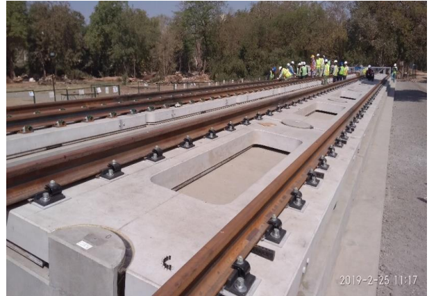
વડોદરાની એચએસઆર તાલીમ સંસ્થામાં સ્ટેબ ટ્રેક સાથે તાલીમ લાઇન નાખવી.