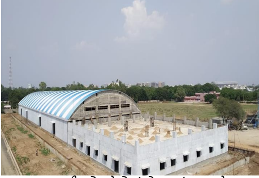
સાબરમતી સ્ટોર ડેપોમાં શેડ (બાંધકામ હેઠળ)

ટેન્ડર આપવાના મુખ્ય કારણ છે - (એ) અમદાવાદ અને સાબરમતી સ્ટેશનોમાં સિઝનલિંગ કેબલ અને ગિયર્સ સ્થળાંતર, અને (બી) અમદાવાદ અને વડોદરા સ્ટેશનો પર વેસ્ટર્ન રેલ્વેથી સંબંધિત ટેલિકોમ, ઓએફસી સાધનો સ્થળાંતર.