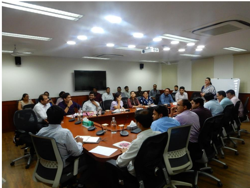
એનએચએસઆરસીએલ કોર્પોરેટનો ઓફિસ સમાં જાપાની ભાષા વર્ગ

એક વર્ષ દરમિયાન, તમારી કંપનીએ એન.એચ.એસ.આર.સી.એલ. ના નિયમિત કર્મચારીઓની ગ્રેચ્યુઇટી અને નિવૃત્તિ પછીના તબીબી લાભો માટેના ભંડોળનું સંચાલન કરવા માટે નવી પેન્શન યોજનામાં ફાળો આપવા ઉપરાંત બે કર્મચારીઓની રચના કરી છે, ઉપરાંત કાર્યકારી રીતે તૈયાર કરેલા વર્કસ્ટેશન્સ અને ખુરશીઓ જેવા વિવિધ કર્મચારીઓના કલ્યાણ પગલાં ચાલુ રાખવા માટે. સ્ટાફ માટે કટિ આધાર સાથે; કાર્યસ્થળ પર ઘોંઘાટ અને ધૂળ મુક્ત વાતાવરણ; સ્ટાફ માટે પૂલ પરિવહન; નિયત વય પછી સ્ટાફ માટે નિયમિત નિવારક આરોગ્ય તપાસણી સુવિધા; વગેરે. ઉપરાંત, તમારી કંપનીએ જાપાન ફાઉન્ડેશનના તેના કર્મચારીઓ માટે સહયોગથી જાપાની ભાષાના વર્ગો પણ આપવાનું શરૂ કર્યું છે. વર્ષ દરમિયાન, તેના અધિકારીઓની બે જૂથો આ કોર્સ પસાર કર્યો છે.