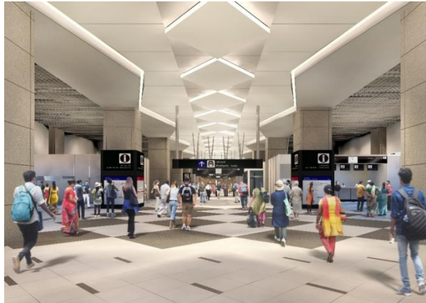
બીલીમોરા ખાતેના એચએસઆર સ્ટેશનનું સૂચિત આંતરિક ભાગ

એમ.એ.એચ.એસ.આર (MAHSR) પ્રોજેક્ટ મુંબઈના બાંદ્રાકુર્લા સંકુલથી શરૂ થઈ અને અમદાવાદના સાબરમતી રેલ્વે સ્ટેશન નજીક સમાપ્ત થાય છે. એમ.એ.એચ.એસ.આર ની પથરેખા (૫૦૮.૦૯ કિ.મી.), ગુજરાત (૮ જિલ્લામાં ૩૪૯.૦૩ કિ.મી.), દાદરા અને નગર હવેલી (૪.૩૦ કિ.મી.) અને મહારાષ્ટ્ર (૪ જિલ્લામાં ૧૫૪.૭૬ કિ.મી.) માંથી પસાર થાય છે. હાઈ સ્પીડ રેલવે કોરિડોરમાં મહારાષ્ટ્ર અને ગુજરાત રાજ્ય એમ બંને રાજ્યમાં મળીને કુલ ૧૨ સ્ટેશન હશે- મુંબઈ, થાણે, વિરાર, બોઇસર, વાપી, બીલીમોરા, સુરત, ભરૂચ, વડોદરા, આણંદ-નડિયાદ, અમદાવાદ, અને સાબરમતી. આ ઉપરાંત ત્રણ ડેપો સૂચવવામાં આવ્યા છે, થાણે અને સુરત ખાતેના એક ડેપો કમશ, અને સાબરમતી ખાતે ડેપો અને વર્કશોપ. પ્રોજેક્ટની અંદાજિત સમાપ્તિ કિંમત રૂ. ૧,૦૮,૦૦૦ કરોડ (આશરે.)