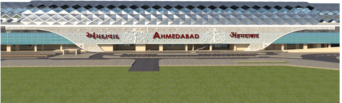
અમદાવાદ ખાતે સૂચિત એચએસઆર સ્ટેશન