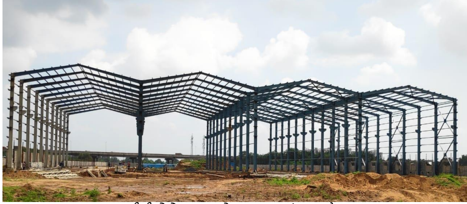
સીપીઓએચ મુખ્ય શેડ, વટવા (બાંધકામ હેઠળ)

ભારતીય રેલ્વે, મેટ્રો અને હાઇ સ્પીડ નેટવર્ક વચ્ચે પેસેન્જર ટ્રાફિકનો પ્રવાહ સરળ બનાવવા માટે એચએસઆરના પેસેન્જર ટર્મિનલ્સને સાબરમતી અને અમદાવાદ ખાતે રેલ્વે અને મેટ્રો સાથે જોડવામાં આવ્યા છે. આના પરિણામે અમદાવાદ વિસ્તારના હાલની રેલવે, રેલ્વે પ્લેટફોર્મ અને અન્ય જાળવણી સુવિધાઓ (આશરે ૧૯ કિલોમીટર સુધી સાબરમતીથી વટવા વચ્ચે) ભારતીય રેલ્વે માળખાઓની નજીકમાં એમએચએચએસઆર ગોઠવણી થઈ છે. તેને વિવિધ રેલ્વે સુવિધાઓ (જેમ કે સ્ટોર્સ ડેપો; સેન્ટ્રલ પિરિઓડિક ઓવરહોલિંગ (સીપીઓએચ) વર્કશોપ; એન્જિનિયરિંગ વર્કશોપ; સાબરમતી ક્ષેત્રમાં ફ્લેશ બટ વેલ્ડિંગ (એફબીડબ્લ્યુ)) પ્લાન્ટ; કોનક્રેટ સાઈડિંગ; અમદાવાદ ખાતે રેલ્વેની વિવિધ કચેરીઓ; રેલ્વે સિગ્નલિંગ; ટેલિકોમ અને સ્થાનાંતરિત કરવાની આવશ્યકતા છે. વિદ્યુત ઉપયોગિતાઓ) હાજર સ્થાનોથી નવા સ્થળો પર.