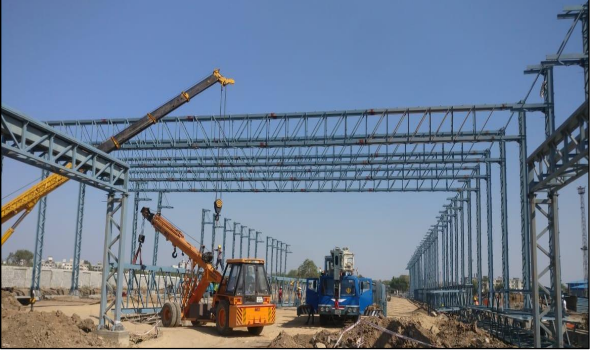
ગેન્ઢી 1 - અમદાવાદ, ગુજરાત, ફલેશ બદ વેલિંગ વર્કશોપ ખાતે બીમ એરેક્શન હેઠળ