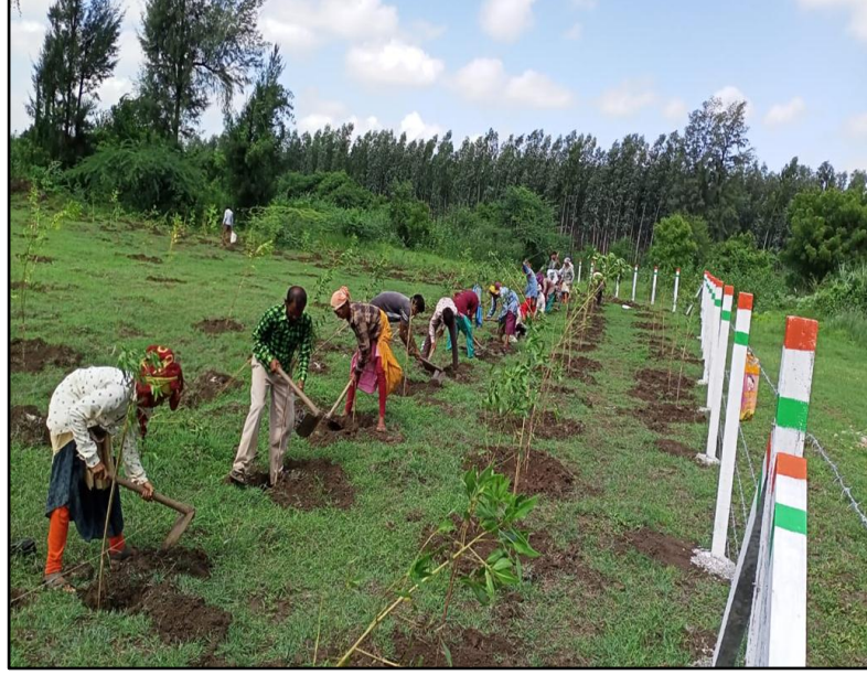
કુડાસદ ગ્રામજનો, રોજગારની તકો, સુરત, ગુજરાત