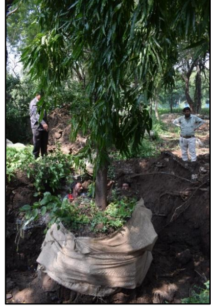
વૃક્ષ પ્રત્યારોપણ, વડોદરા, ગુજરાત