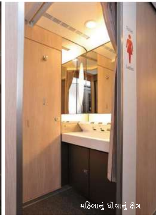
મહિલાનું ધોવાનું ક્ષેત્ર