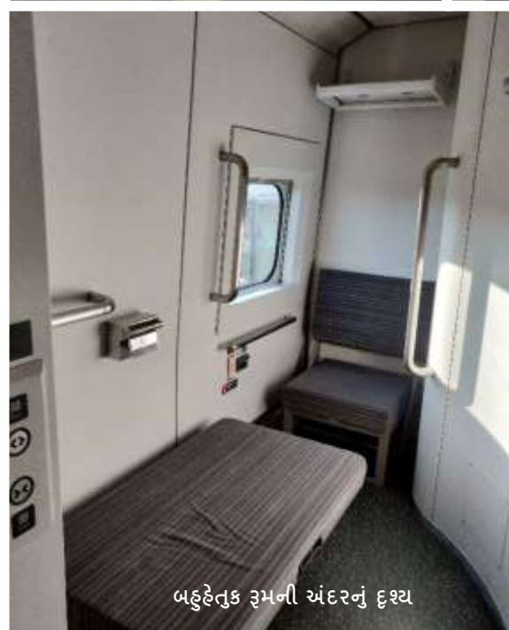
બહુહેતુક રૂમની અંદરનું દૃશ્ય