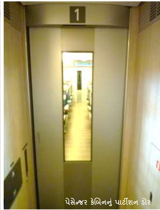
પેસેન્જર કેબિનનું પાર્ટીશન ડોર