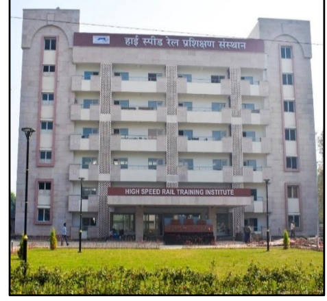
રોઇંગ બોર્ડથી ગ્રાઉન્ડ રિયાલિટી - એચએસઆર ટ્રેનિંગ ઇન્સ્ટિટ્યૂટ, વડોદરા, ગુજરાત