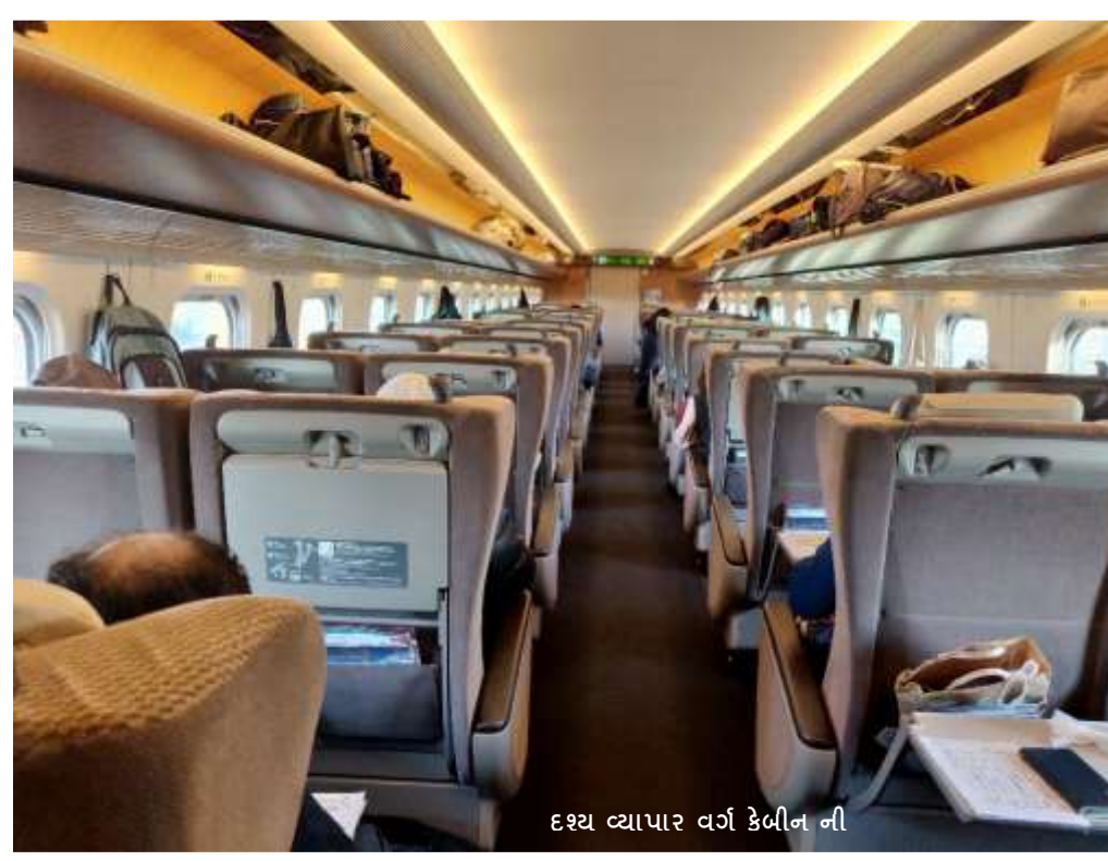
દશ્ય વ્યાપાર વર્ગ કેબીન ની