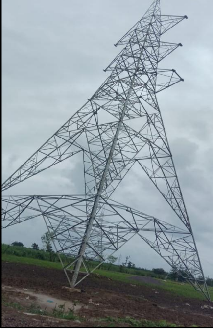
220 કેવી લાઇનનું ટાવર ઉભું કરવું (એટલે કે વાપી / ખારદપડા અને વાપી / મંગલવાડે કોસિંગ ચેન્જ 169.334) વાપી, ગુજરાત