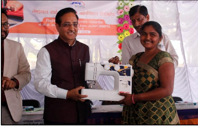
અમદાવાદ, ગુજરાત, આવક પુનસ્થાપન યોજના તાલીમના ભાગ લેનારાઓને સિલાઈ મશીનનું વિતરણ

આવક પેદા કરવા માટે મહિલાઓને તેમની કુશળતા વધારવા માટે, તમારી કંપની દ્વારા ફેબ્રુઆરી - માર્ચ 2020 માં, ગ્રામીણ સ્વરોજગાર તાલીમ સંસ્થાઓ (RSETI) ના સહયોગથી અમદાવાદના ચેનપુર અને રોપડા ગામોની મહિલાઓ માટે એક મહિનાનો સ્ટેરિંગ અને ટેલરિંગ કોર્સ યોજવામાં આવ્યો છે. આ કોર્સમાં 23 મહિલાઓએ (એટલે કે ચેનપુરની 9 મહિલાઓ અને રોપડાની 14 મહિલાઓ) હાજરી આપી હતી, જેમને કોર્સ પૂર્ણ થયા પછી સીવણ મશીન આપવામાં આવ્યાં હતાં.