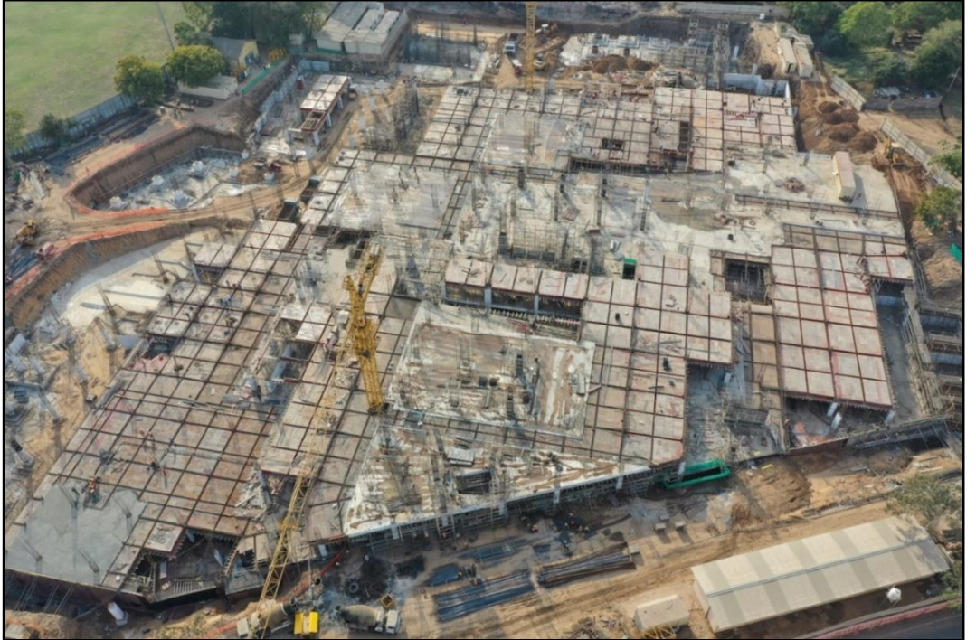
પેસેન્જર ટર્મિનલ હબ, સાબરમતી, ગુજરાત ખાતે ગ્રાઉન્ડ ફ્લોર સ્ટેલ બનાવવાનું કામ પ્રગતિમાં છે

ટ્રેક કાર્યોના સંદર્ભમાં ડ્રાફ્ટ સ્પષ્ટીકરણો તૈયાર કરવામાં આવ્યા છે અને અંતિમકરણ હેઠળ છે.