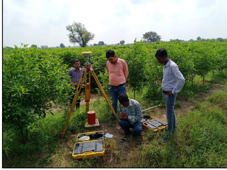
ભરૂચ જિલ્લો, ગુજરાતના કોઠી વાતરસા ગામમાં માર્ક ઓફ વે માર્કિંગ અને પિલર ફિક્સિંગ