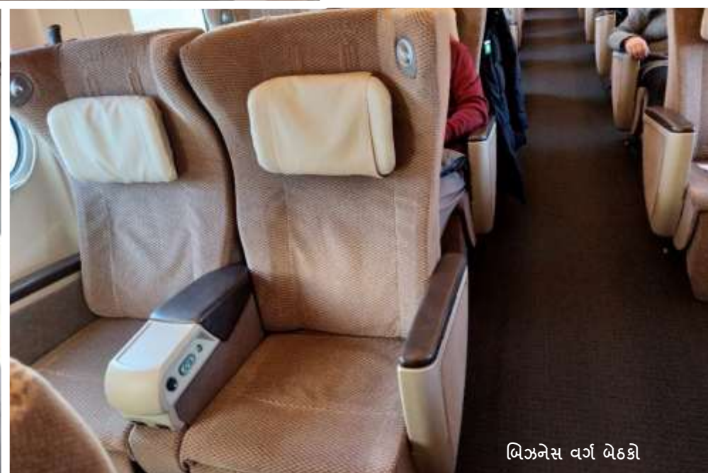
બિઝનેસ વર્ગ બેઠકો