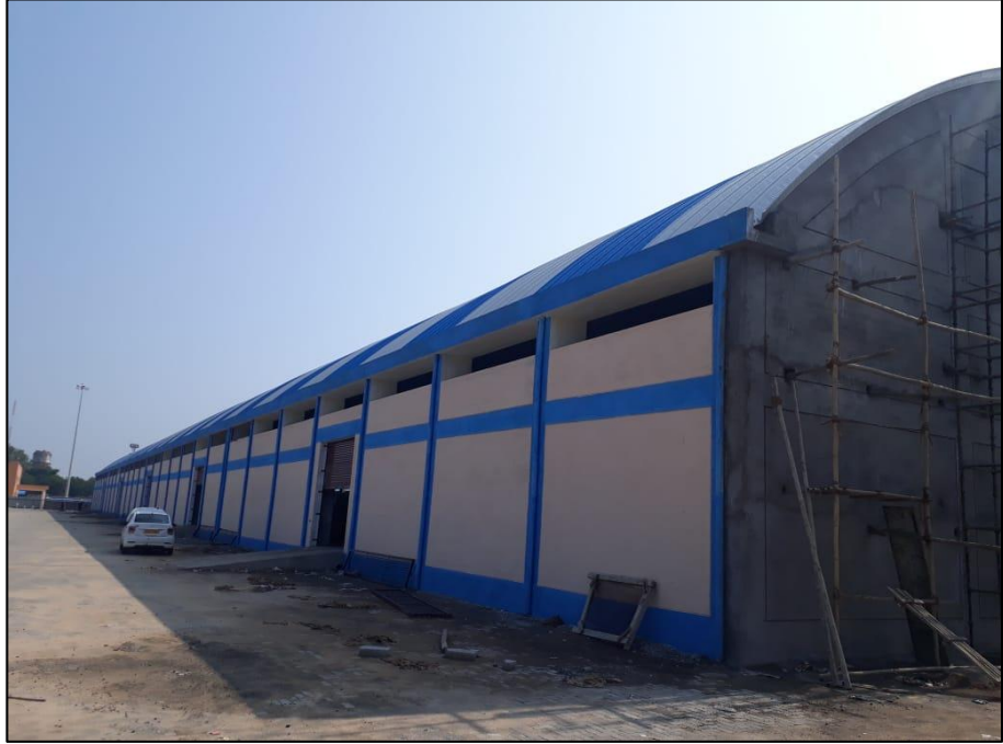
બાહ્ય અંતિમ કામો કોન્ક્રીટ ખોડીયાર વેરહાઉસ 2, સાબરમતી, ગુજરાત ખાતે પ્રગટિમાં છે

વર્ષ દરમિયાન, ગ્રીન હાઇ સ્પીડ રેલ (HSR) રેટિંગ માટે પાયલોટ સંસ્કરણ પણ ભારતીય ગ્રીન બિલ્ડિંગ કાઉન્સિલ (IGBC) દ્વારા પ્રથમ વખત ભારતમાં કોઈ HSR પ્રોજેક્ટ માટે વિકસાવવામાં આવ્યું છે.