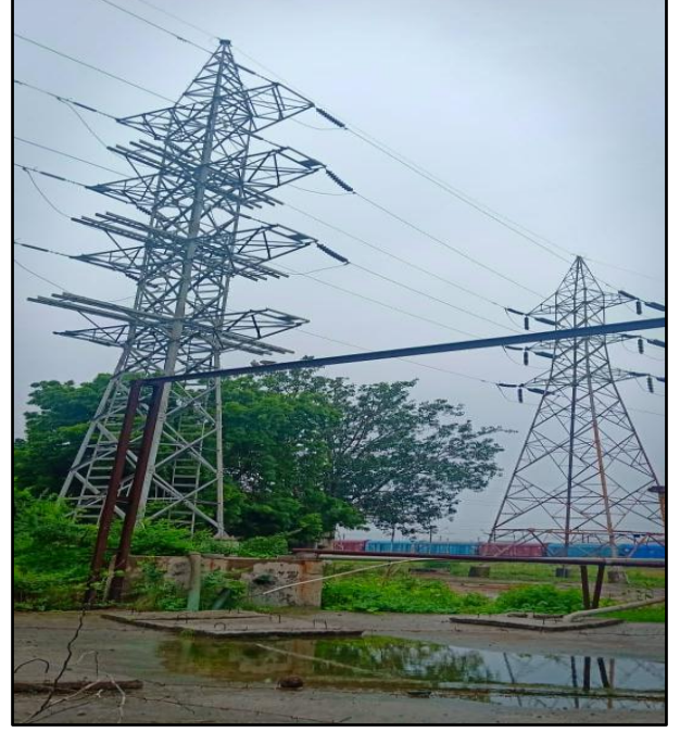
ગુજરાતના વટવા ખાતે ટોરેન્ટ પાવર લિમિટેડ દ્વારા ટાવર ઉભા કરવા અને સ્ટ્રેન્ગિંગનું કામ