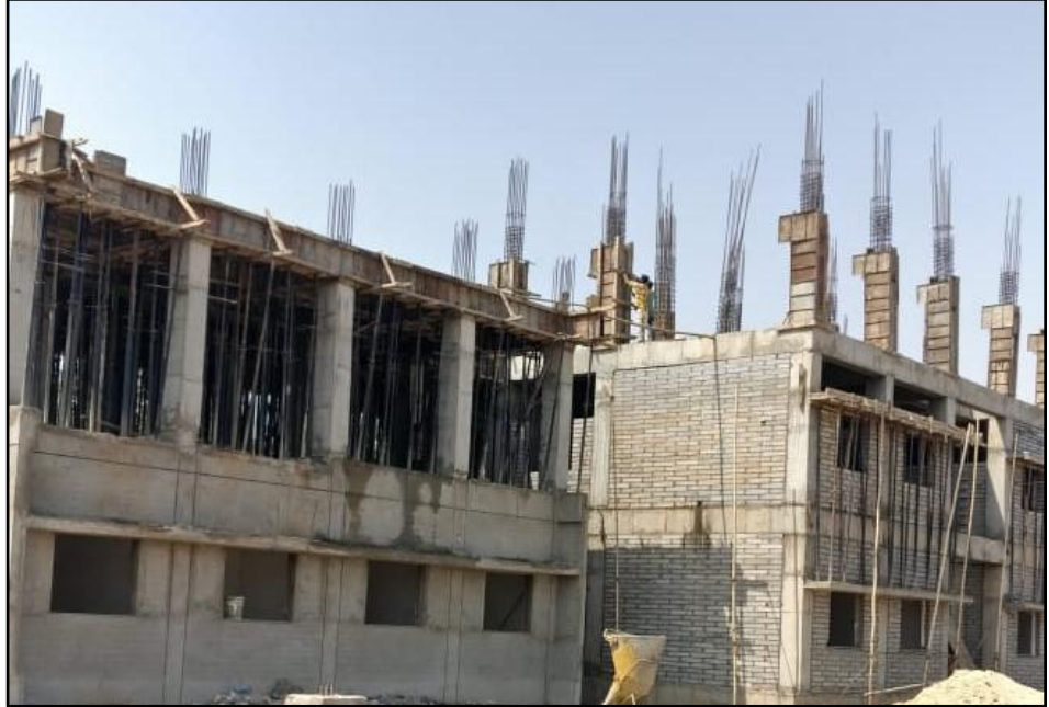
અમદાવાદ, ગુજરાત, બ્રિજ વર્કશોપના એડમિનિસ્ટ્રેશન બિલ્ડિંગમાં સ્લેબ અને કોલમ, રિઇનફોર્સમેન્ટ અને આરસીસી કાર્ય પ્રગતિમાં છે