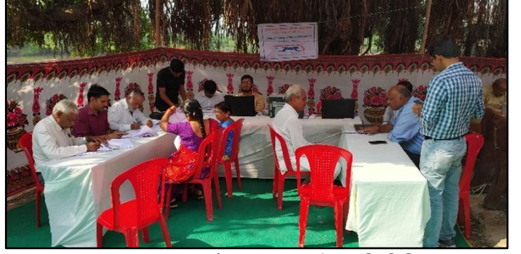
ભરૂચ, ગુજરાત, જમીન સંપાદન માટે સંમતિ શિબિર