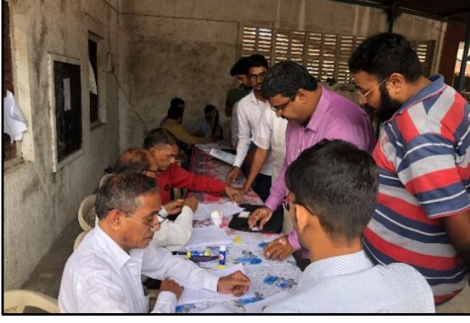
ગુજરાતના સુરતનાં નીચોલ ગામમાં જમીન સંપાદન માટે સંમતિ શિબિર