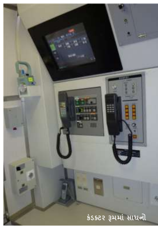
કંડક્ટર રૂમમાં સાધનો