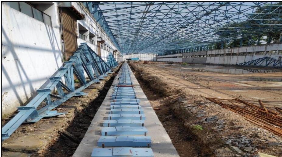
ગોલિયાથ ફાઉન્ડેશન, બિજ વર્કશોપ, સાબરમતી, ગુજરાત ખાતે કાર્ય કરે છે

RTI પ્રશ્નો સામાન્ય રીતે જમીન સંપાદન, ભરતી અને બુલેટ ટ્રેન પ્રોજેક્ટ વિશેની સામાન્ય માહિતી વગેરે સંબંધિત હોય છે અને સામાન્ય રીતે નિયત સમયમાં જવાબ આપવામાં આવે છે. વર્ષ દરમિયાન પ્રાપ્ત થયેલી તમામ 76 અરજીઓનો નિકાલ કરવામાં આવ્યો છે.