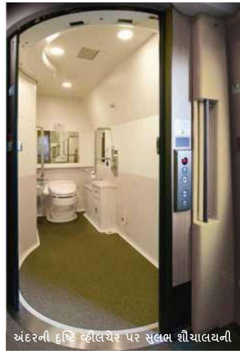
અંદરની દૃષ્ટિ વ્હીલચેર પર સુલભ શૌચાલયની