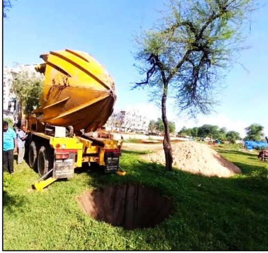
અમદાવાદ, ગુજરાત ખાતે ટ્રી ટ્રાન્સપ્લાન્ટેશન