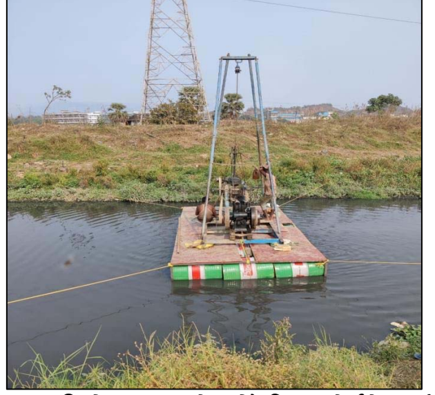
પાલઘર જિલ્લો, મહારાષ્ટ્ર ખાતે જીઓટેકનિકલ ઇન્વેસ્ટીગેશન વર્ક

વધુમાં, તમારી કંપનીએ, 2020-21 માં હાઇ સ્પીડ રેલ ટેકનોલોજી (સિગ્નલિંગ, ટેલિકમ્યુનિકેશન, ઓપરેશન કંટ્રોલ સેન્ટર (OCC), રોલિંગ સ્ટોક અને ડેપો સિસ્ટમ્સ સહિત) નો દુનિયાભરમાં અભ્યાસ કરવા માટે આંતરરાષ્ટ્રીય સલાહકાર પેઢીની સેવા લીધેલ છે. કન્સલ્ટન્ટ દ્વારા ડ્રાફ્ટ રિપોર્ટ 2020-21 દરમિયાન સમીક્ષા માટે રજૂ કરવામાં આવ્યો છે. એવી અપેક્ષા છે કે આ અભ્યાસ ફાઇનાન્સિયલ વર્ષ 2021-22 દરમિયાન પૂર્ણ થશે.