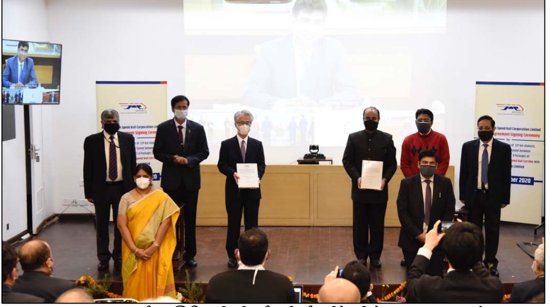
જાપાનના રાજદૂતની ઉપસ્થિતિમાં એલએન્ડી સાથે સી-4 પેકેજ કોન્ટ્રાક્ટ પર હસ્તાક્ષર કાર્યક્રમ