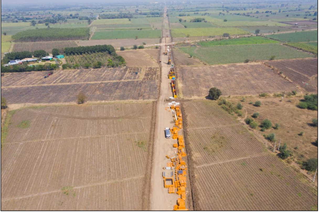
સુરત, ગુજરાત ખાતે એમએએચએસઆર બાંધકામ પ્રગતિ પર

તમારી કંપનીએ તેના કર્મચારીઓ માટે જાપાન ફાઉન્ડેશન સાથે જોડાણમાં જાપાનીઝ ભાષા પ્રાવીણ્ય ટેસ્ટ (JLPT)ની શિક્ષા આપવાનું પણ ચાલુ રાખેલ છે. .