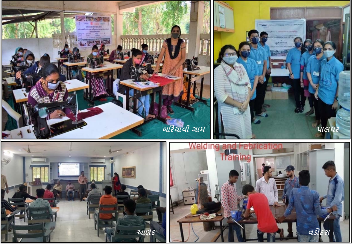
ગુજરાત અને મહારાષ્ટ્ર ખાતે આઈઆરપી હેઠળ આયોજીત વિવિધ તાલીમ અભ્યાસક્રમો

સુધારવા અન્ય પગલાઓ સાથે સાથે રીહેબીલીટેશન અને રીસેટલમેન્ટ (R&R)માં સહાય મેળવવા મદદ કરવાના શમન પગલાં વિકસાસવવા તથા તેમના સામાજિક-આર્થિક ધોરણો અને આજીવિકા ક્ષમતા સુધારવા માટેનાં પગલાં લેવામા આવ્યા છે. આ પ્રોજેક્ટ માટે પ્રસ્તાવિત ઇનકમ રિસ્ટોરેશન પ્લાન(IIRP) નો ઉદ્દેશ પ્રોજેક્ટ અફફેક્ટેડ હાઉસહોલ્ડ (PAHs) (પ્રોજેક્ટ અસરગ્રત પરિવારો) ની આવક પ્રોજેક્ટ પહેલાના સ્તરે અથવા વધુ સારી રીતે ડેવલપ કરવાનો છે, અને PAHs ના પુનર્વસનનો એક મહત્વપૂર્ણ ભાગ છે. PAHs પાસે તેમની વર્તમાન પ્રવૃત્તિઓ અને કુશળતાને વેગ આપવા માટે રચાયેલ વિવિધ વિકલ્પોમાંથી પસંદગી કરવાની તક હશે. તમામ PAPs ઉપલબ્ધ વિકલ્પો વિશે સારી રીતે માહિતગાર રહે અને તેમને ભાગ લેવાની પૂરતી તક આપવામાં આવે તેની ખાતરી માટે વિસ્તૃત સલગ્નતા હાથ ધરવામાં આવેલ છે.