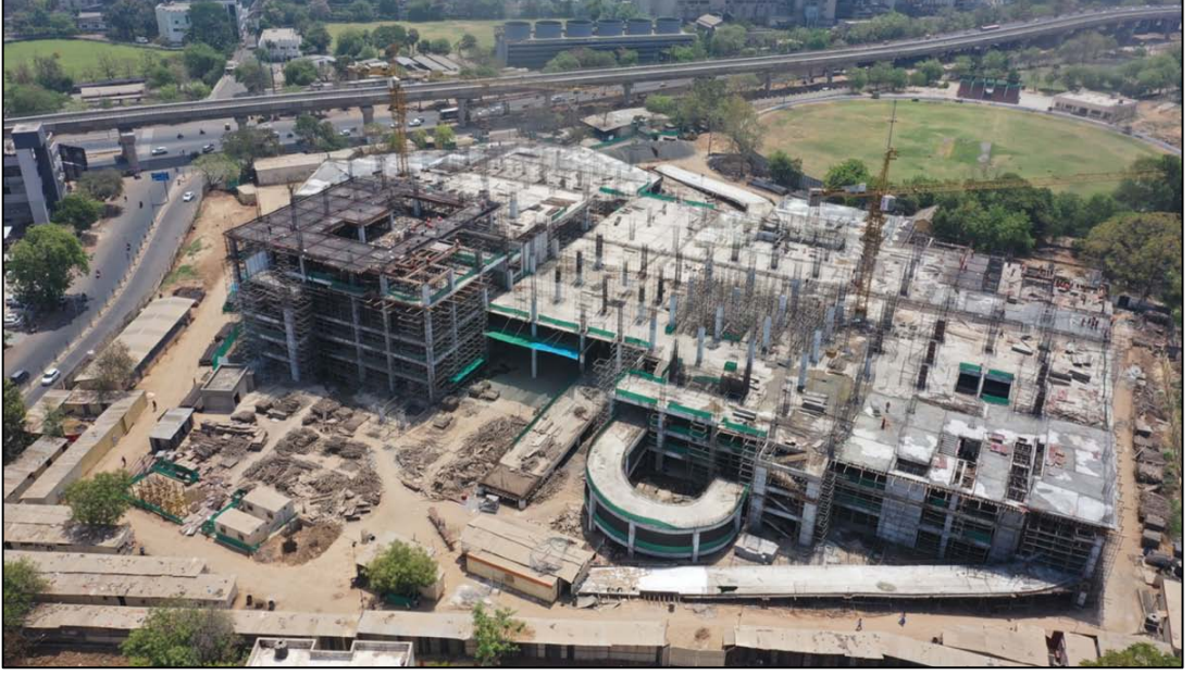
એચએસઆર સાબરમતી ટર્મિનલ, ગુજરાત ખાતે વિવિધ સ્તરે સ્ટેલ બાંધકામની કામગીરી પ્રગતિમય છે