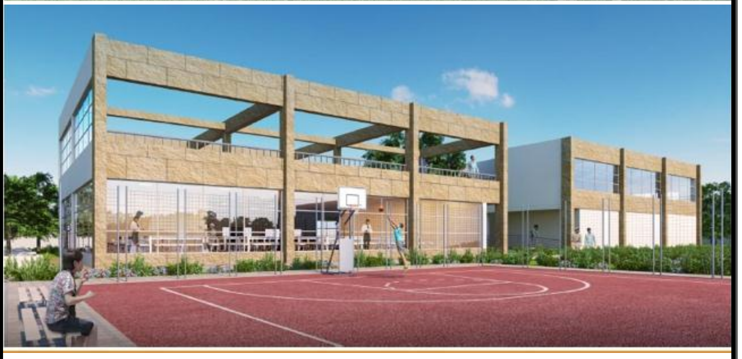
સુવિત દ્રશ્ય તાલીમ સંસ્થા જેવી કે રેસિડેન્સિયલ બ્લોક, સુવિધાઓથી લઈ તાલીમ વગેરે.