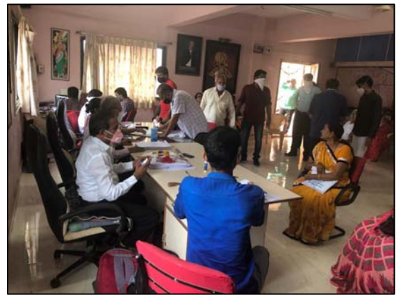
સુરત, ગુજરાતના કુદસદ ગામ ખાતે જમીન હસ્તાંતરણ માટે સહમતિ (કોન્સેન્ટ) કેમ્પ

iii) જમીનનું વળતર 31 માર્ચ 2021 ના રોજ ખાનગી જમીન માટે રૂ. 4998.01 કરોડ ચૂકવવામાં આવ્યા છે [ગુજરાતમાં અને DD અને DNH માં: રૂ. 4,103.24 કરોડ અને મહારાષ્ટ્રમાં: 894.77 કરોડ].