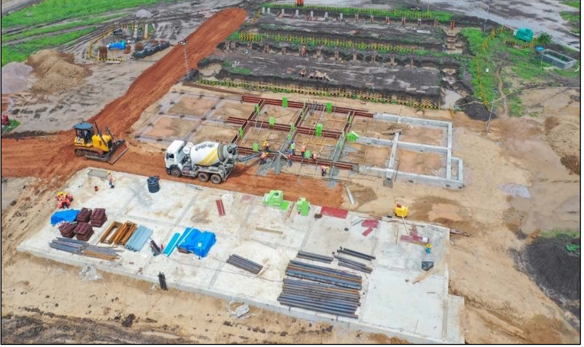
પ્રિ-કાસ્ટ યાર્ડ, વડોદરા, ગુજરાત