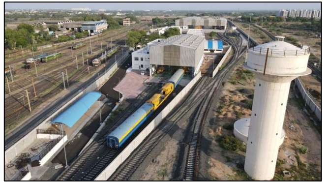
ટ્રેક મશીન મેન્ટેનન્સ, સીપીઓએચ વટવા, ગુજરાત

iii) પશ્ચિમ રેલવેની સંપત્તિને જેવી કે સ્ટોર્સ ડેપો અને સેન્ટ્રલ સામયિકઓવરહોલિંગ (CPOH) વર્કશોપ સ્થાનાંતરિત કરવામાં આવેલ છે અને પૂર્ણ થયા પછી સોંપવામાં આવેલ છે. એન્જિનિયરીંગ વર્કશોપમાં બધાં જ મુખ્ય સિવિલ અને ઇલેક્ટ્રિકલ કામો પૂર્ણ થઈ ગયા છે અને અંતિમ કમીશનીંગ પ્રગતિ હેઠળ છે.