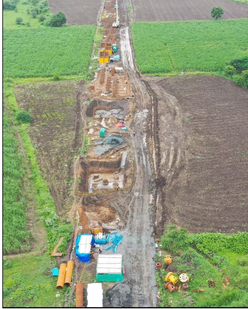
સુરત, ગુજરાત ખાતે પિલિંગ કાર્ય પ્રગતિમય

CSR કમિટી, તેની રચના, હાજરી, CSR બજેટ, CSR પ્રવૃત્તિઓ વગેરે વિશેની ડિટેલ્સનો ઉલ્લેખ 'CSR પ્રવૃત્તિઓ પરના વાર્ષિક અહેવાલમાં' જે ડાયરેક્ટર્સ રિપોર્ટનો એક ભાગ છે તે આ અહેવાલ સાથે પરિશિષ્ટ - I તરીકે જોડેલ છે.