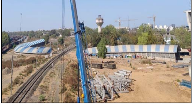
સાબરમતી ક્રિકેટ મેદાન, ગુજરાત નજીક આરયુબી-1નું રિલોકેશન

ii) CONCOR નો ઇનલેંડ કન્ટેનર ડેપો અને રોડ અંડર બ્રિજ (સાબરમતી ક્રિકેટ ગ્રાઉન્ડ પાસે) ને સ્થાનાંતરિત કરવામાં આવેલ છે અને પૂર્ણ થયા પછી સોંપવામાં આવેલ છે.