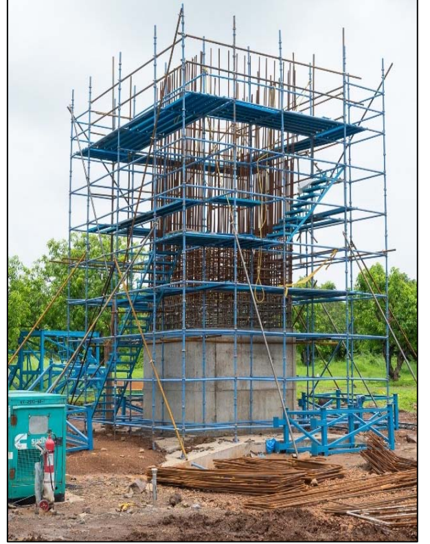
વલસાડ, ગુજરાત ખાતે સ્તંભ નિર્માણની પ્રગતિમય શટરિંગ કામગીરી

આગળ, P4 (X) અને P4 (Y) કોન્ટ્રાક્ટ પેકેજો પર કામ, જે જાન્યુઆરી 2021 માં L&T - IHI કન્સોલિડેશનને આપવામાં આવેલ છે, તે માર્ચ 2021 થી શરૂ થયું છે. શરૂઆતમાં, આ પેકેજો જાપાનીઝ કોન્ટ્રાક્ટરો માટે હતા. ભારતીય સાઈડની પહેલ પર, આ કરારો ભારતીય કોન્ટ્રાક્ટરો માટે પણ ખોલવામાં આવ્યા છે, જેમાં જાપાનીઝ શિંકનસેન માટે ગુણવત્તાના ધોરણો જાળવવા માટે આંતરરાષ્ટ્રીય દેખરેખની કેટલીક વિશેષ જોગવાઈઓ છે.