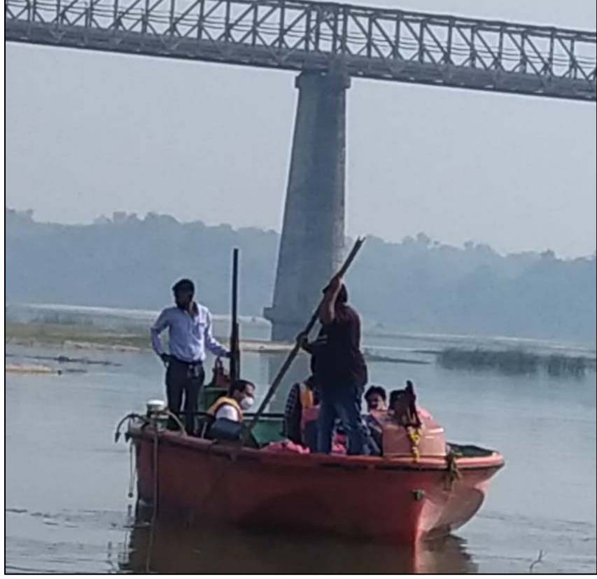
માહિ નદી, વડોદરા, ગુજરાત ખાતે કરવામાં આવતો બાથીમેટ્રી સરવે