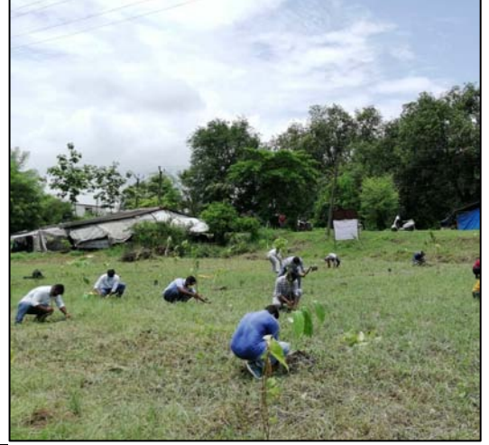
સુરત, ગુજરાત ખાતે પ્લાન્ટેશન વર્ક્સ