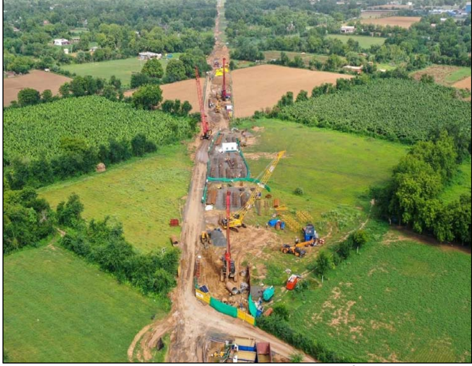
વડોદરા, ગુજરાત ખાતે પિલ્લે પાઇવ બોરિંગ વર્ક્સ

ફાઇનાન્સિયલ રિસ્કને સબંધે, પર્યાપ્ત આંતરિક નિયંત્રણનાં પગલાં અપનાવવામાં આવે છે અને કંપનીએ અનુભવી ચાર્ટર્ડ એકાઉન્ટન્ટ્સની બાહ્ય ફીર્મ ઇન્ટરનલ ઓડિટર્સ તરીકે જોડેલ છે. આંતરિક નિયંત્રણો અને પગલાંઓમાં સુધારા માટે ઇન્ટરનલ ઓડિટર્સ, વૈધાનિક ઓડિટર્સ અને C&AG ઓડિટ ટીમ દ્વારા આપવામાં આવેલી ભલામણો સમય સમય પર અમલ કરવામાં આવે છે.