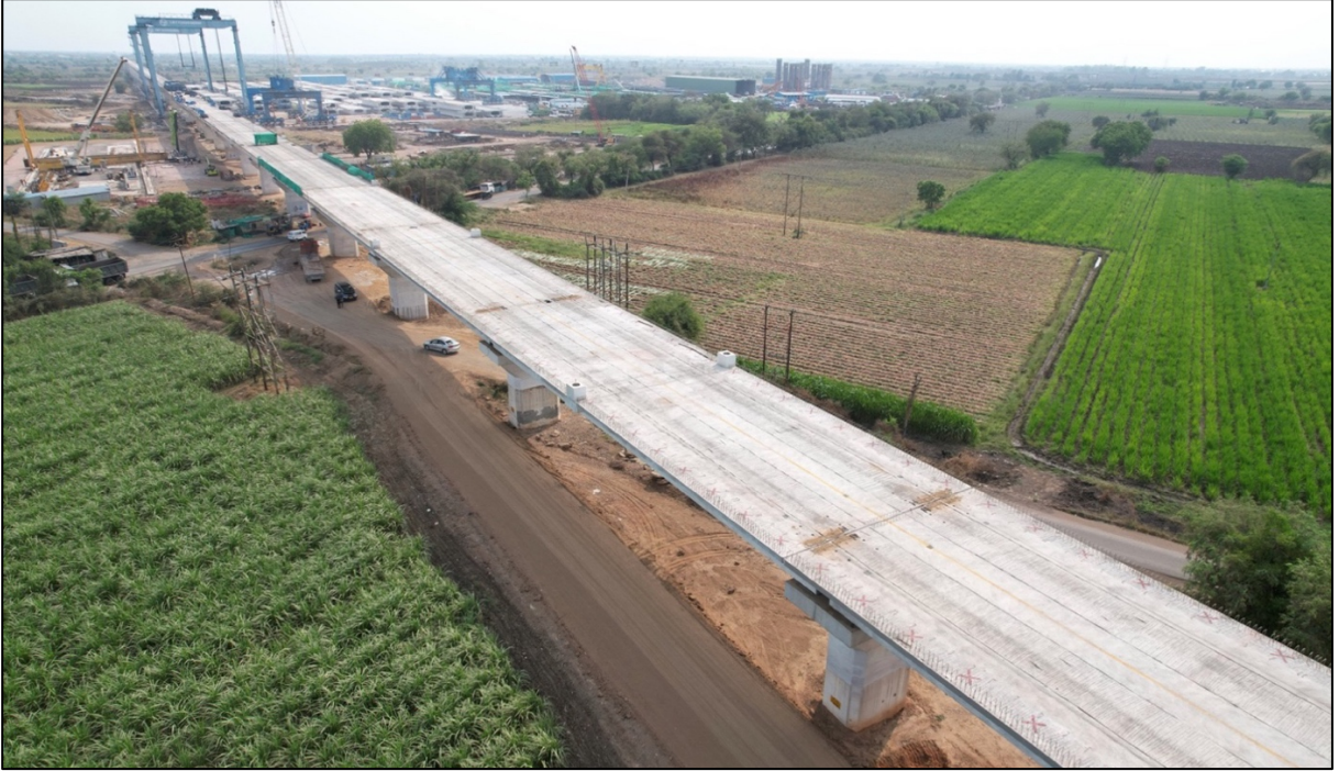
पूर्ण व्हायाडक्ट भाग, वडोदरा, गुजरात