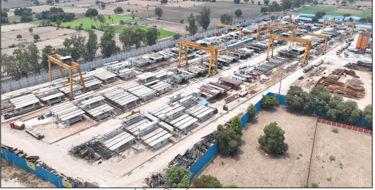
सेगमेंटल कास्टिंग यार्ड, अहमदाबाद, गुजरात