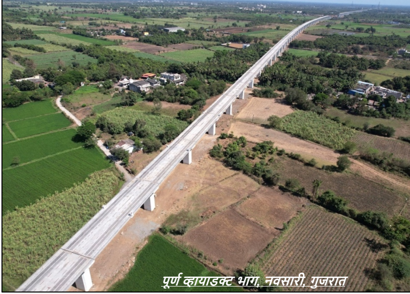
पूर्ण व्हायडक्ट भाग, नवसारी, गुजरात