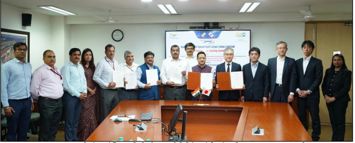
जपान हाय स्पीड रेल इलेक्ट्रिक इंजिनीअरिंग कंपनी लिमिटेड (जेई) बरोबर शिष्टमंडळ करारावर स्वाक्षरी