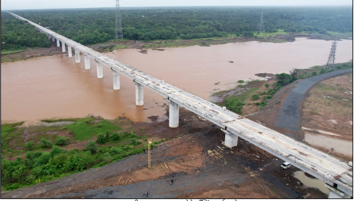
पार नदी, वलसाड, गुजरात येथे लाँन्गिंग पूर्ण झाले