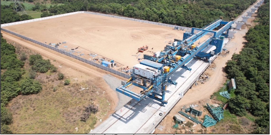
फुल स्पॅन गर्डर लॉन्चिंग प्रगतीपथावर आहे, नवसारी, गुजरात

या कॉरिडॉरच्या संदर्भात डीपीआर कार्य हाती घेण्यासाठी कंपनीने उचललेली पावले खाली दिली आहेत: