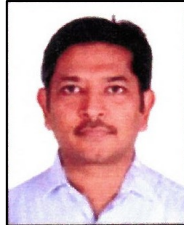
परराग जै नैनुतिया अधिवेळ संचालक