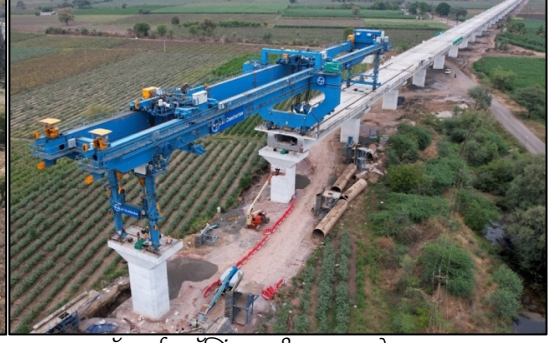
फुल स्पॅन गर्डर लॉन्चिंग प्रगतीपथावर आहे, भरुच, गुजरात