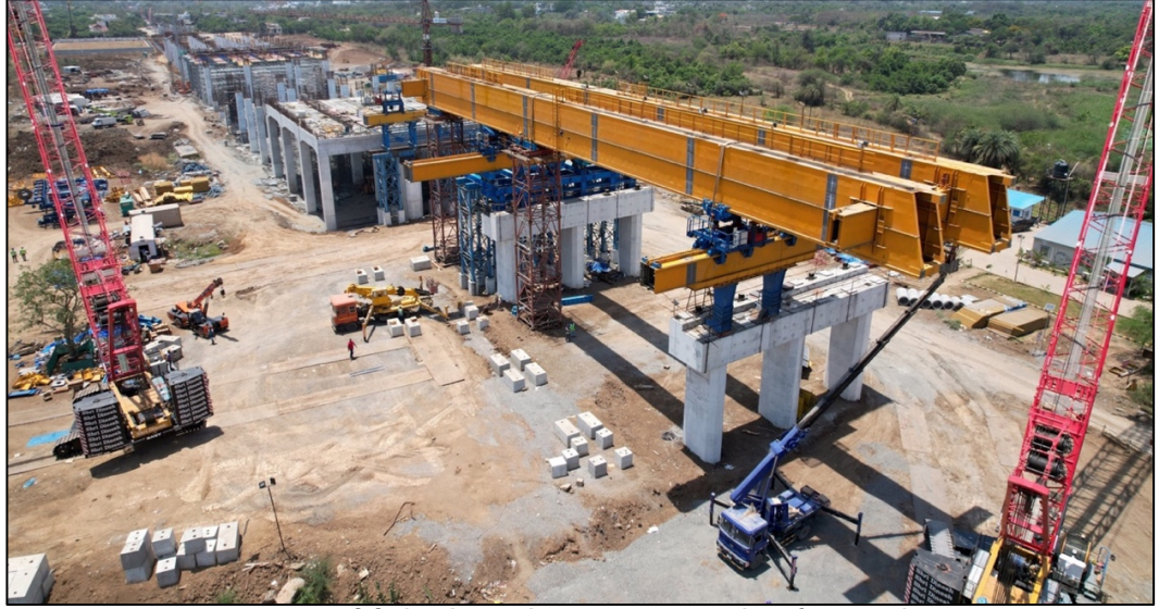
एचएसआर बिलिमोरा स्टेशन अग्रोच व्हायाडक्ट सुरू करणे प्रगतीपथावर आहे.