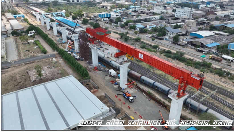
सेगमेंटल लाँचिंग प्रगतिपथावर आहे, अहमदाबाद, गुजरात