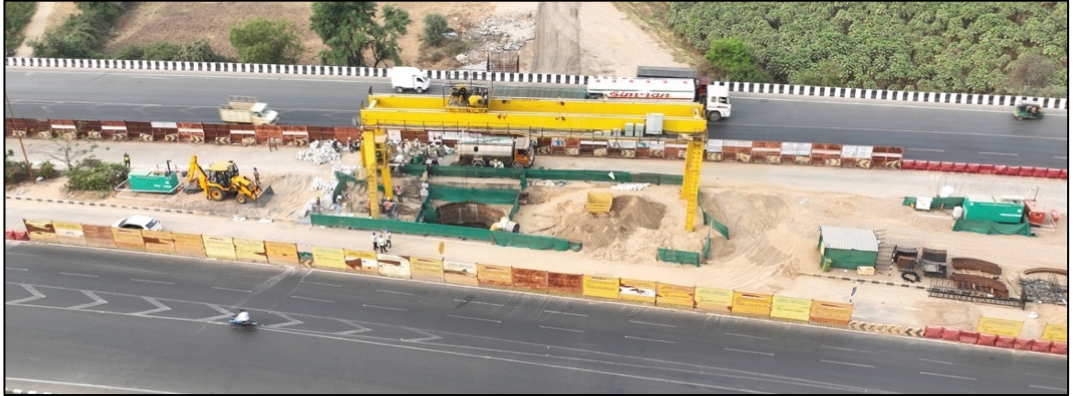
गुजरातमधील वडोदरा येथे शिसो पाईलचे काम प्रगतीपथावर

या सर्व स्टेशन आणि डेपोसाठी बांधकाम स्टेज डिझाइन सुरू करण्यात आले आहे आणि मॉकअप, दुकान रेखाचित्रे, फॅब्रिकेशन रेखाचित्रे आणि साइटच्या अंमलबजावणीवर लक्ष केंद्रित करून प्रगती करत आहे.