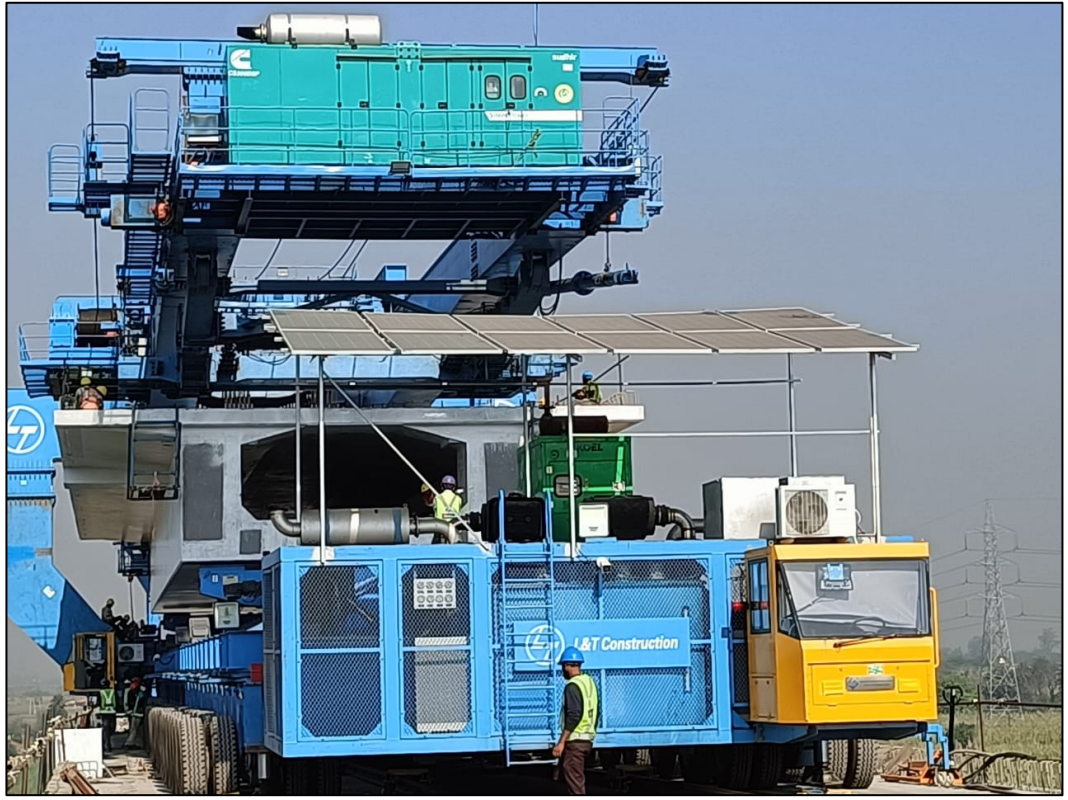
गर्डर ट्रान्सपोर्टरवर ऑपरेटर केबिनच्या एसीला वीज देण्यासाठी सोलर पॅनेल देण्यात आले

2022-23 दरम्यान, एनर्जी कन्झर्वेशन बिल्लिंग कोड (ईसीबीसी) च्या आधारे, ऊर्जा संरक्षण सक्षम करणाऱ्या तरतुदी सिव्हिलच्या सर्व 5 पॅकेजेस (उदा. सी1 आणि सी3), डेपोमधील इमारतींच्या इलेक्ट्रिकल आणि मेकॅनिकल सिस्टमच्या तांत्रिक वैशिष्ट्यांमध्ये समाविष्ट केल्या आहेत. (उदा. डी1 आणि डी2), आणि इलेक्ट्रिकल कामे (उदा. इडब्ल्यू-1) पॅकेजेस.