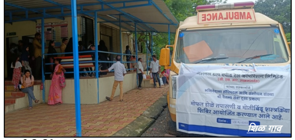
मोतीबिंदू शस्त्रक्रिया ओळखण्यासाठी शिबिरे, ठाणे, महाराष्ट्र