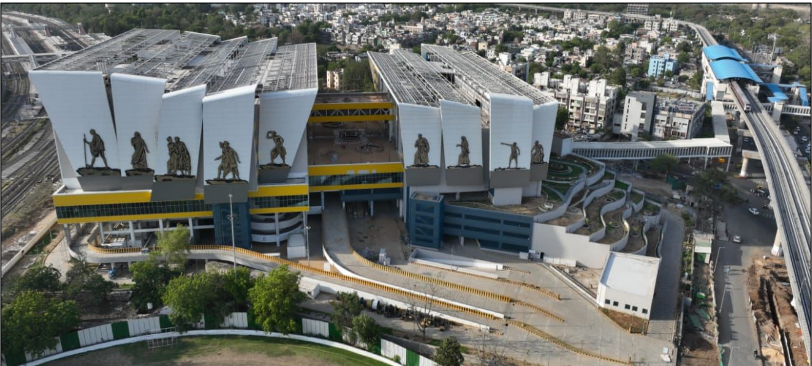
पैसेंजर हब टर्मिनल, साबरमती, गुजरात