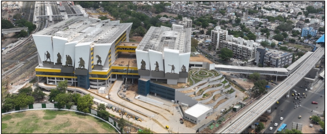
गुजरातमधील साबरमती पॅसेंजर टर्मिनल हब येथे फिनिशिंगचे काम प्रगतीपथावर आहे

31 मार्च 2023 पर्यंत या पॅसेंजर हबच्या बांधकामाची भौतिक प्रगती 96% पर्यंत पोहोचली आहे.