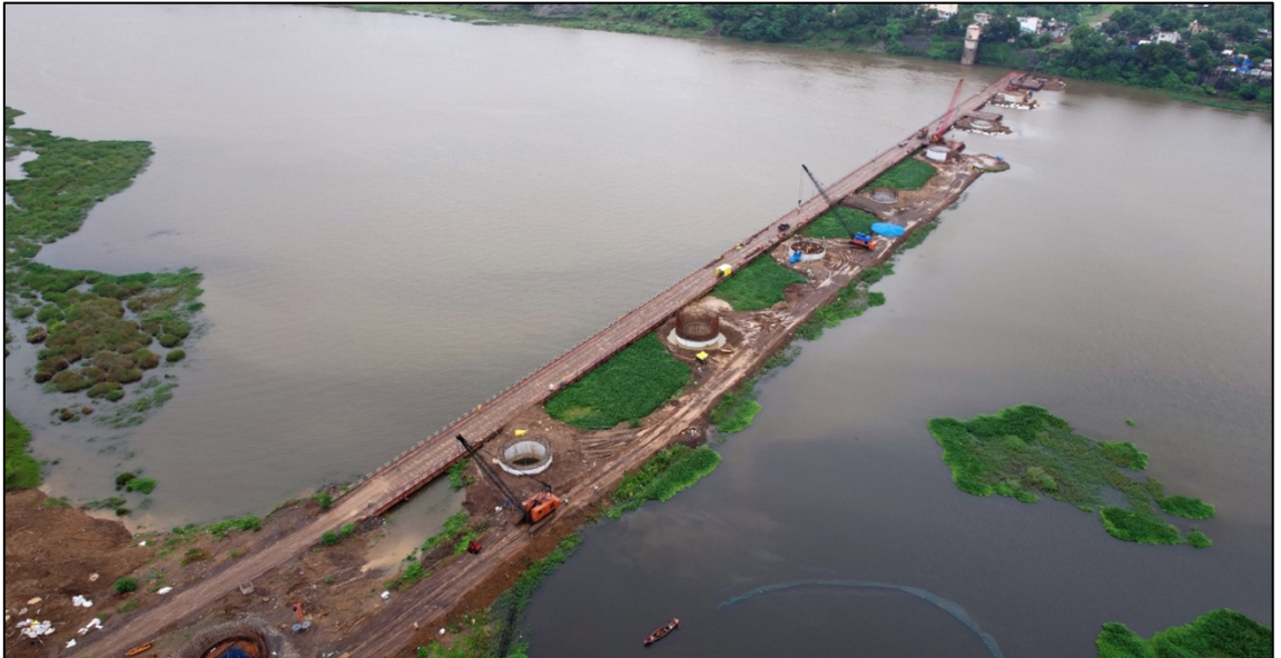
तापी नदी, सुरत, गुजरात येथे विहिरीच्या पायाभरणीचे काम प्रगतीपथावर