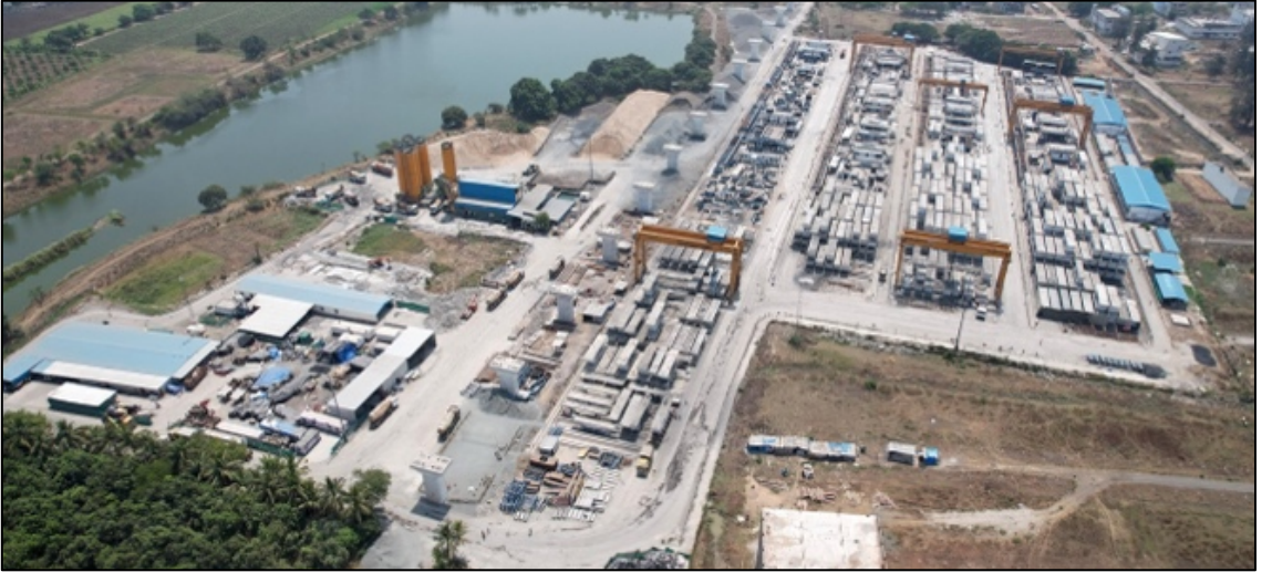
सेगमेंटल कास्टिंग यार्ड, सुरत, गुजरात

उपरोक्त पॅकेजेस प्रदान केल्यामुळे, गुजरात राज्यातील 352 किमी (508 किमी पैकी) लांबीच्या वायडव्हाइस, स्टेशन्स, सिव्हिल आणि ट्रॅक कामांसाठी सर्व जेआयसीए कॉन्ट्रॅक्ट पॅकेज देण्यात आले आहेत.