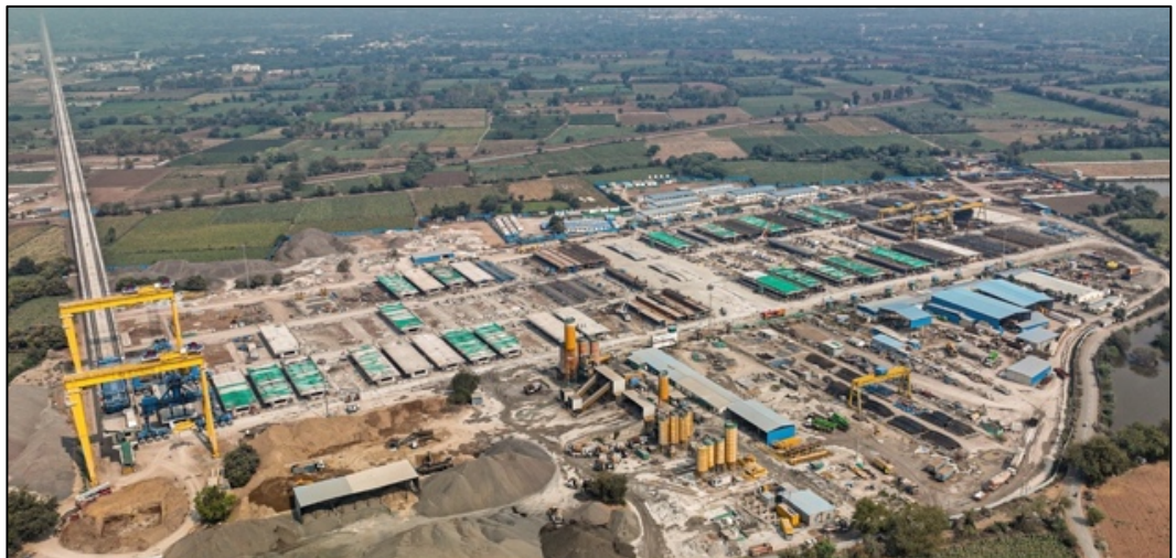
एफएसएलएम कास्टिंग यार्ड, आणंद, गुजरात

एनएचएसआरसीएल ही जगातील मोजक्या संस्थांपैकी एक आहे जिने बांधकामाच्या एमएसएलएम तंत्रात प्रभुत्व मिळवले आहे. हे तंत्र पारंपारिक स्पॅन बाय स्पॅन (एसबीएस) पद्धतीपेक्षा 10 पट वेगवान आहे आणि एमएसएलएम द्वारे एसबीएस अंतर्गत सायकल वेळ 7 दिवसांवरून 16 तासांपर्यंत कमी करते.