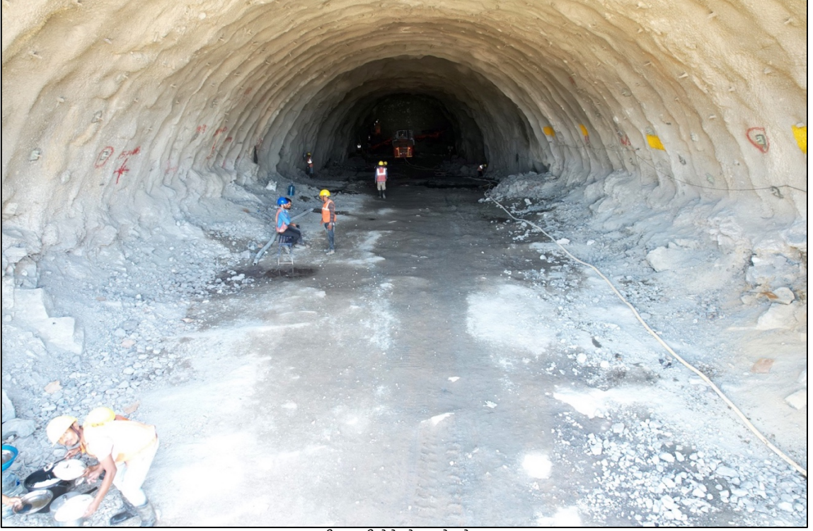
गुजरातमधील वापी येथे बोगद्याचे खोदकाम सुरू

उपरोक्त पॅकेजेस प्रदान केल्यामुळे, गुजरात राज्यातील 352 किमी (508 किमी पैकी) लांबीच्या वायडव्हाइस, स्टेशन्स, सिव्हिल आणि ट्रॅक कामांसाठी सर्व जेआयसीए कॉन्ट्रॅक्ट पॅकेज देण्यात आले आहेत.