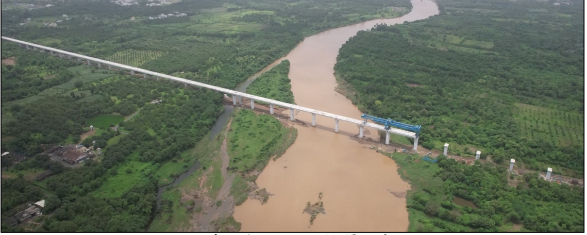
औरंगा नदी, वलसाड, गुजरात येथे लॉन्गिंग पूर्ण

पोलादी पूल, प्री-स्ट्रेसड काँक्रीट पूल, नदीवरील पूल यांची निर्मितीही सुरू आहे. तुमच्या कंपनीने आजपर्यंत पार, पूर्णा, मिंधोळा, अंबिका आणि औरंगा नद्यांवर पाच नदी पूल पूर्ण केले आहेत.