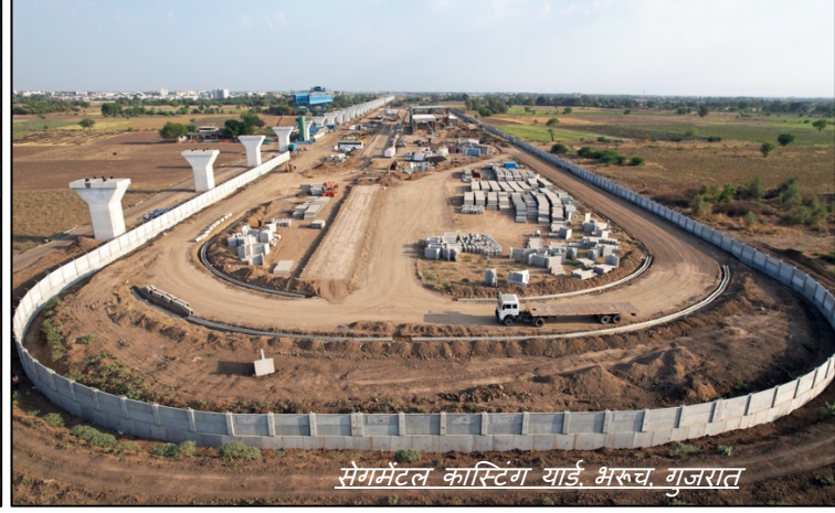
सेगमेंटल कास्टिंग यार्ड, भरुच, गुजरात