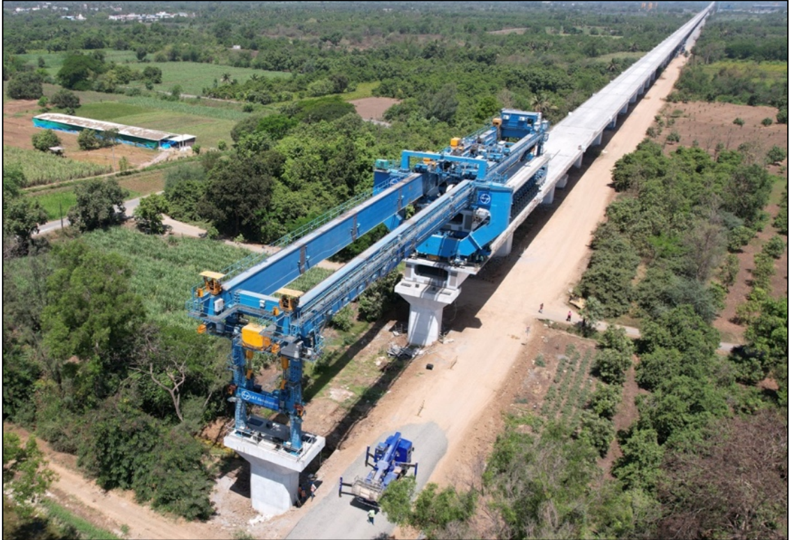
पूर्ण स्पॅन गर्डर लॉन्चिंग प्रगतीपथावर, नवसारी, गुजरात