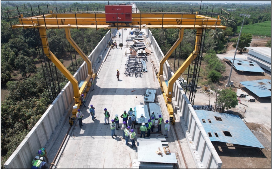
ध्वनी अडथळा उभारणीचे काम प्रगतीपथावर आहे, नवसारी, गुजरात

आमची कंपनी ट्रेड मार्क्स कायदा, 1999 अंतर्गत, तिच्या आधीपासून नोंदणीकृत ट्रेडमार्कच्या विविध भिन्नतेची नोंदणी करण्याच्या प्रक्रियेत आहे.