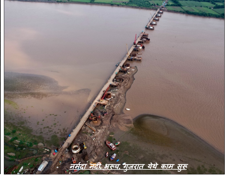
नर्मदा नदी, भरुच, गुजरात येथे काम सुरु