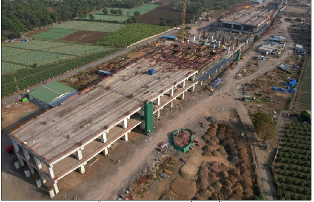
गुजरातमधील सुरत एचएसआर स्थानकात काम प्रगतीपथावर आहे