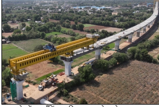
सेगमेंटल लॉन्चिंग प्रगतीपथावर आहे, वडोदरा, गुजरात