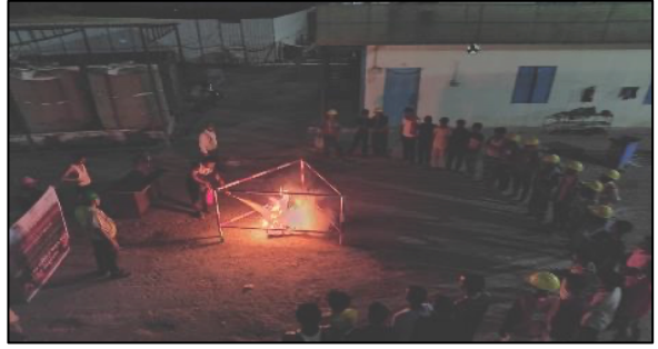
वडोदरा, गुजरात येथे अग्निशामक प्रशिक्षण कार्यक्रमांचे आयोजन