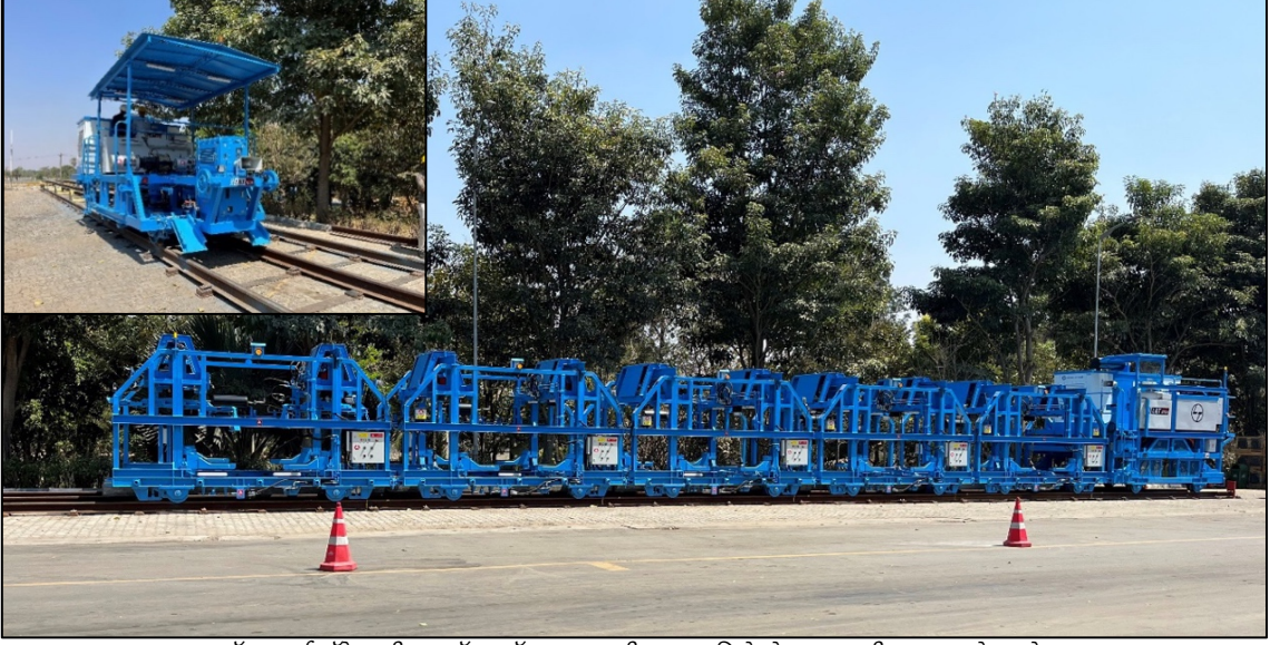
ट्रॅक वर्क्स (पॅकेज टी 2) - ट्रॅक स्लॅब टाकण्याची कार आणि रेल्वे टाकण्याची कार (इनसेटमध्ये), गुजरात