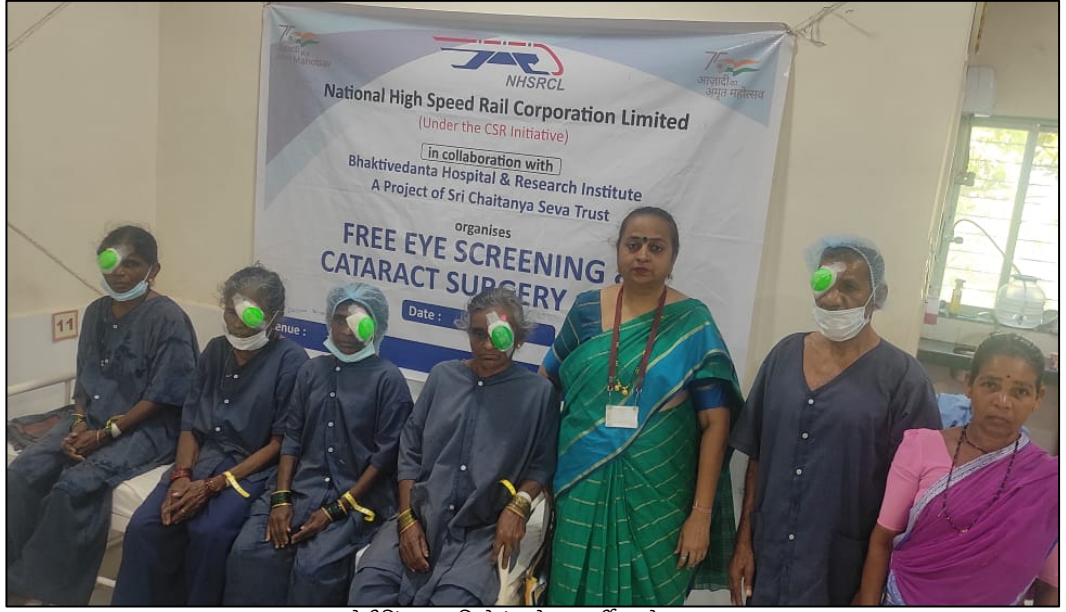
मोतीबिंदू शस्त्रक्रियेनंतरचे लाभार्थी, ठाणे, महाराष्ट्र