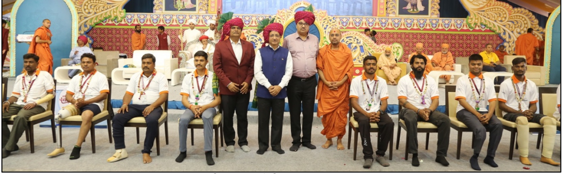
कृत्रिम अवयवांचे वितरण, आणंद, गुजरात