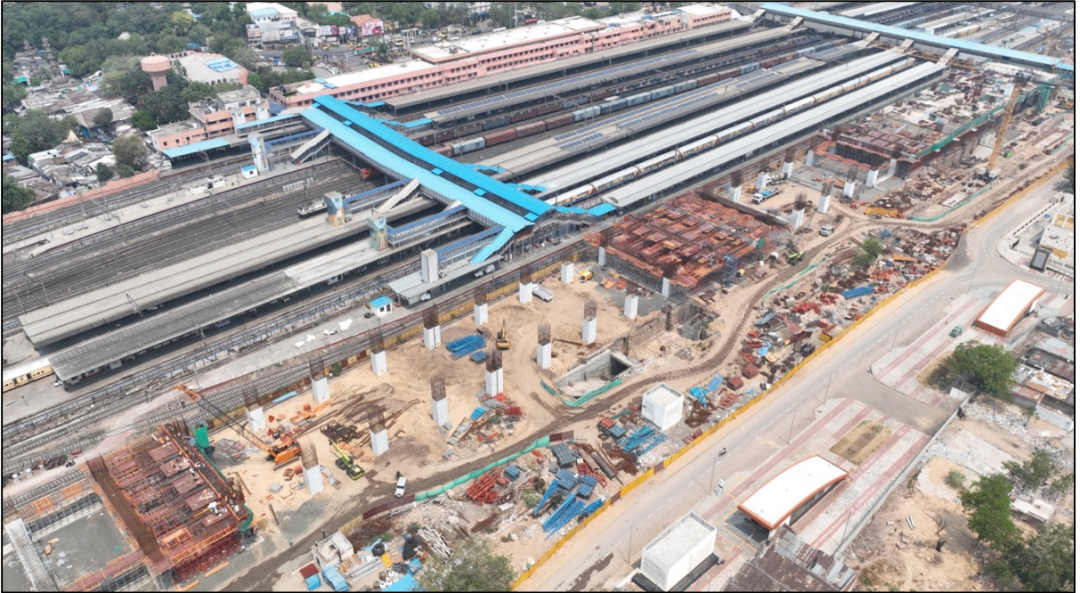
अहमदाबाद एचएसआर स्टेशन, गुजरात येथे काम प्रगतीपथावर आहे

कंपनीचा वार्षिक अहवाल खालील लिंकवर उपलब्ध आहे - https://nhsrcl.in/mr/about-us/annual-report