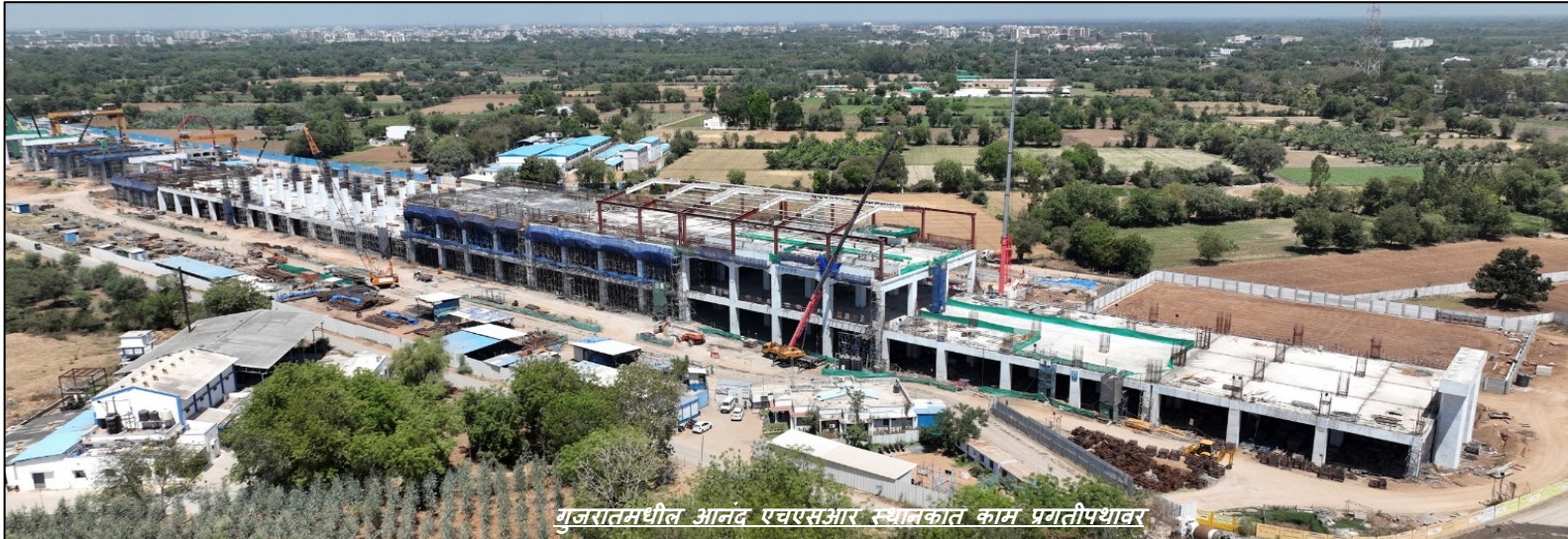
गुजरातमधील आनंद एचएसआर स्थानकात काम प्रगतीपथावर