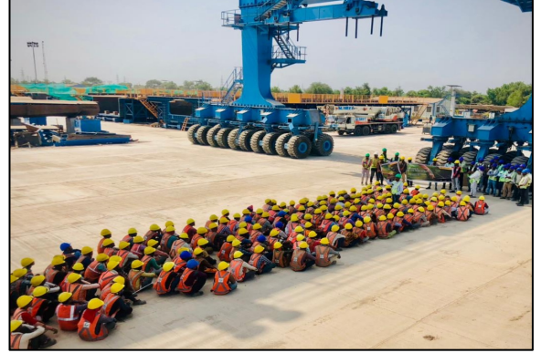
गुजरातमधील सुरत येथे क्लास रूम ट्रेनिंग प्रोग्रॅम आणि मास ट्रल बॉक्स टॉक्सचे आयोजन