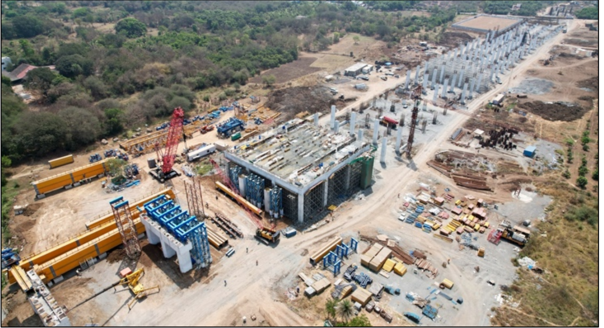
गुजरातमधील बिलीमोरा एचएसआर स्थानकात काम प्रगतीपथावर