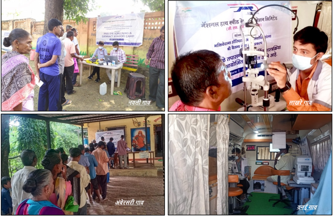
मोतीबिंदू शस्त्रक्रियेसाठी ओळख शिबिरे, पालघर, महाराष्ट्र