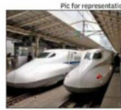
The bidders for the 237-km stretch of the mainline are all Indian companies

Officials said the 237km corridor will cross 24 rivers and 30 road crossings. "This entire section