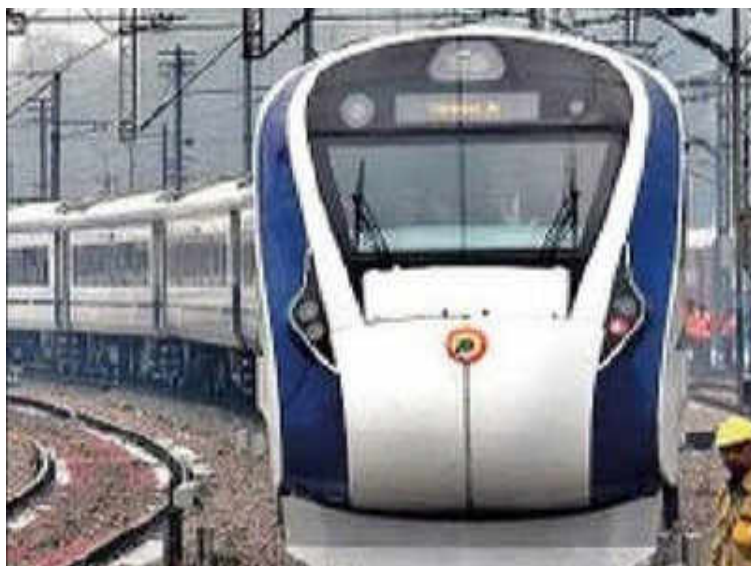
Bullet train tender opens, all seven bidders are Indian

NEW DELHI: The National High Speed Rail Corporation (NHSRCL) on Wednesday opened the bids for first tender entailing investment of around Rs 20,000 crore for construction work for the Ahmedabad-Mumbai bullet train project. All the bidders for this 237 km length of the mainline falling in Gujarat are Indian companies.