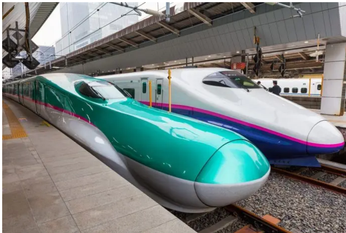
Mumbai-Ahmedabad Bullet Train Project

AHMEDABAD (Metro Rail News): Big industry players, including Larsen & Toubro (L&T) , Tata Projects , JMC Projects and NCC have evinced interest in the Mumbai-Ahmedabad bullet train project . As technical bids for the design and construction of 237 kilometres in the Mumbai-Ahmedabad corridor was opened on Wednesday, a total of three bids were submitted — by L&T and two separate consortia of companies.