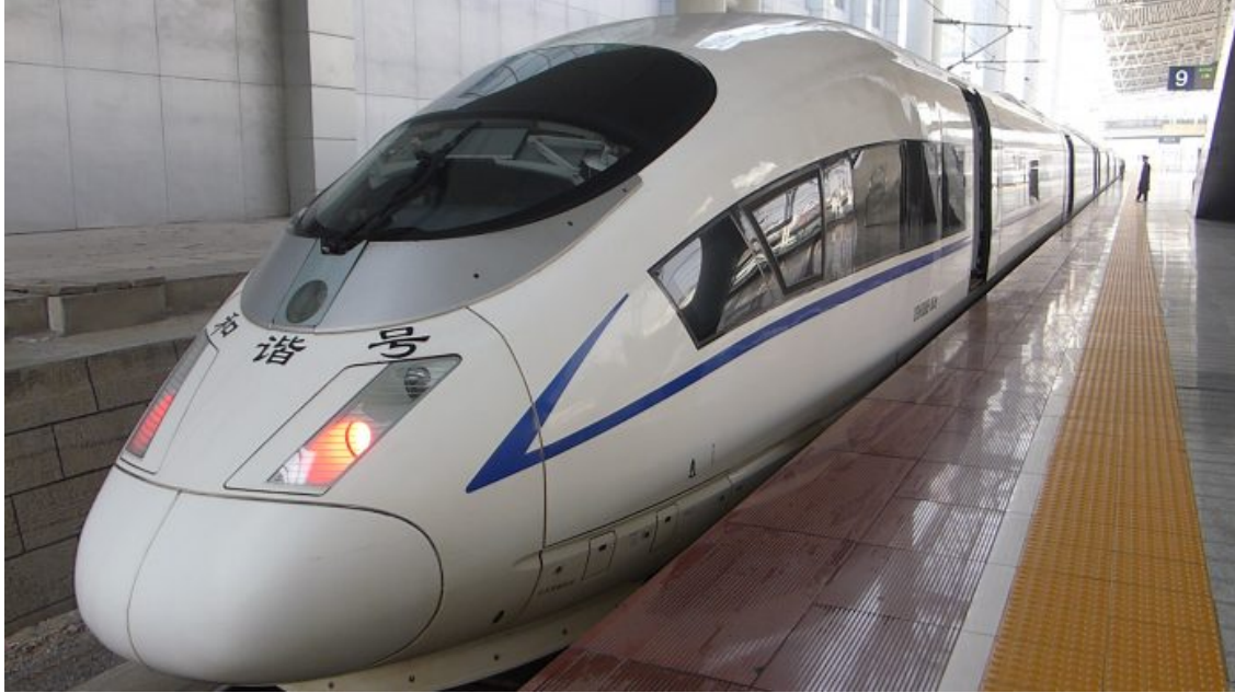
जापानी बुलेट ट्रेन | प्रतीकात्मक तस्वीर