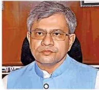
अश्विनी वैष्णव • फाइल फोटो

वह सरकार की महत्वाकांक्षी अहमदाबाद-मुंबई बुलेट ट्रेन परियोजना की समीक्षा करने पहुंचे थे। उन्होंने कहा कि बुलेट ट्रेन के लिए बुनियादी ढांचों के निर्माण में बेहतर प्रगति हुई है। इस परियोजना पर काम बहुत तेजी से चल रहा है। रेल मंत्री ने कहा कि 2026 तक पहली बुलेट ट्रेन चलाने के लक्ष्य को ध्यान में रखते हुए काम हो रहा है और उन्हें पूरा भरोसा है कि इस लक्ष्य को हासिल कर लिया जाएगा। बता दें कि विलिमोरा दक्षिण गुजरात के नवसारी जिले का शहर है। अहमदाबाद और मुंबई के बीच 508