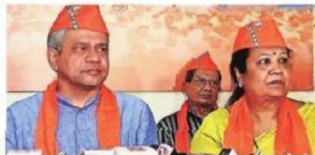
Union Railway Minister Ashwini Vaishnaw with MoS for Railways and Surat MP Darshana Jardosh on Monday.

High Speed Rail Corporation Limited (NHSRCL) said over 90 per cent of the total land required for the bullet train project has been acquired. More than 98.8 per cent of the land has been acquired in Gujarat, while 100 per cent is acquired in Dadra and Nagar Haveli (Union Territory) and 71.5 per cent in