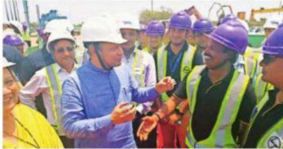
Railway minister Ashwini Vaishnav (third from left) inspected the ongoing work on the Mumbai-Ahmedabad bullet train project in Surat on Monday.

While the Central government has put the onus on the state government behind the delay in starting work, the project