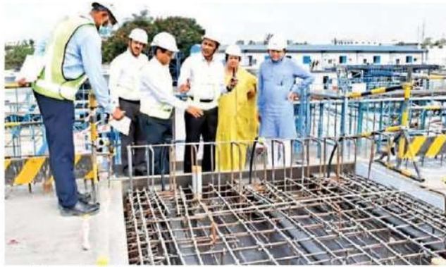
सूरत में सोमवार को बुलेट ट्रेन प्रोजेक्ट का निरीक्षण करते रेलमंत्री अश्विनी वैष्णव।

जब तक महाराष्ट्र में जमीन अधिग्रहण कार्य पूरा नहीं हो जाता, रेलवे इसी सेक्शन पर फोकस करेगी। पहला सेक्शन सूरत से