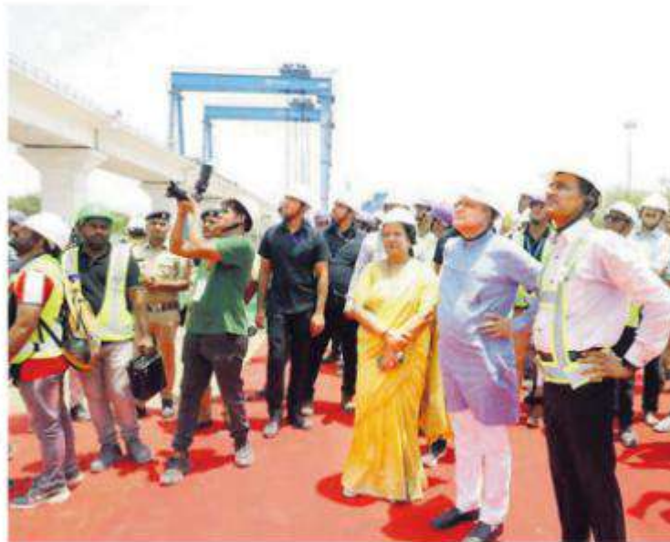
Railway Minister Ashwini Vaishnaw inspects the bullet train project in Surat

"We are keeping the target of running the first bullet train between Surat and Bilimora in 2026. The progress is very good, and we are confident of running the train by that time," he said, during his