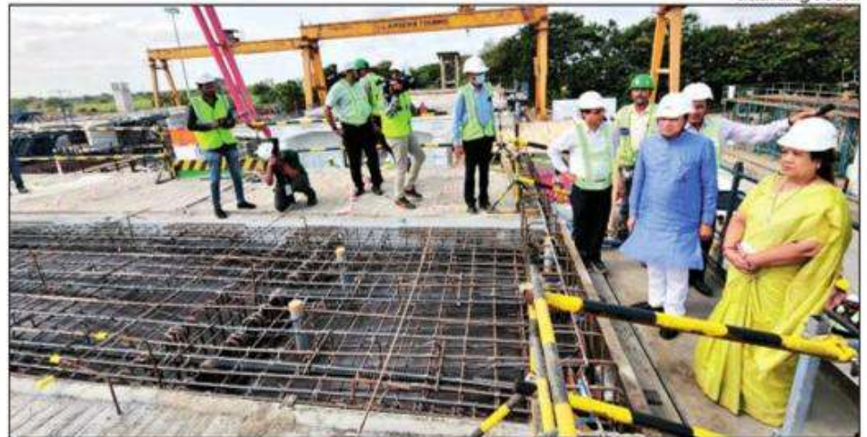
Railway minister inspecting progress of bullet train project

The project is aimed at running the bullet train between Ahmedabad and Mumbai on a high-speed rail (HSR) corridor at a speed of 320 kmph, covering a distance