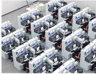
Simulators (classroom type) for Driver Consoles.

NEW DELHI: Drivers of India's bullet train will get specialised training from Japanese-made state-of-the-art simulators to learn how to drive high speed trains. The training simulators will help the drivers, conductors, instructors and train/rolling stock maintenance staff to understand the driving theory of