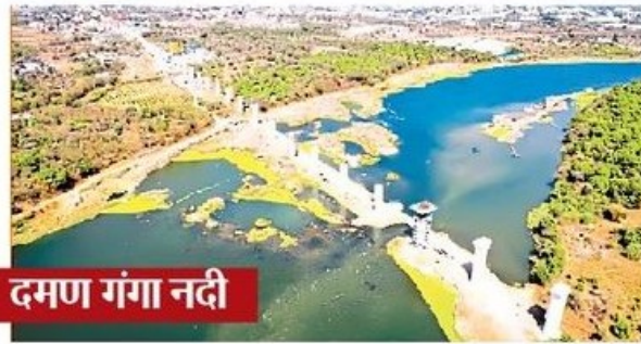
दमण गंगा नदी

अहमदाबाद. मुंबई-अहमदाबाद के बीच बुलेट ट्रेन परियोजना के तहत विभिन्न नदियों पर पुल का निर्माण कार्य जोरों पर जारी है। मुंबई अहमदाबाद हाई स्पीड रेल (एमएचएसआर) कॉरिडोर पर गुजरात व महाराष्ट्र में विभिन्न नदियों पर कुल 24 पुल हैं। इनमें से गुजरात के भरूच जिले में नर्मदा नदी पर 1.2 किलोमीटर