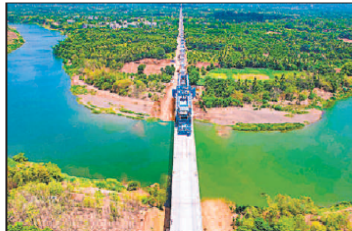
Thane, Virar and Boisar stations will come under the 135.45 km elevated line which will connect Shilphata to Zaroli village.

The last leg is important considering the paucity of land that NHSRCL was facing for this project for a long time. In fact, in February, they finally