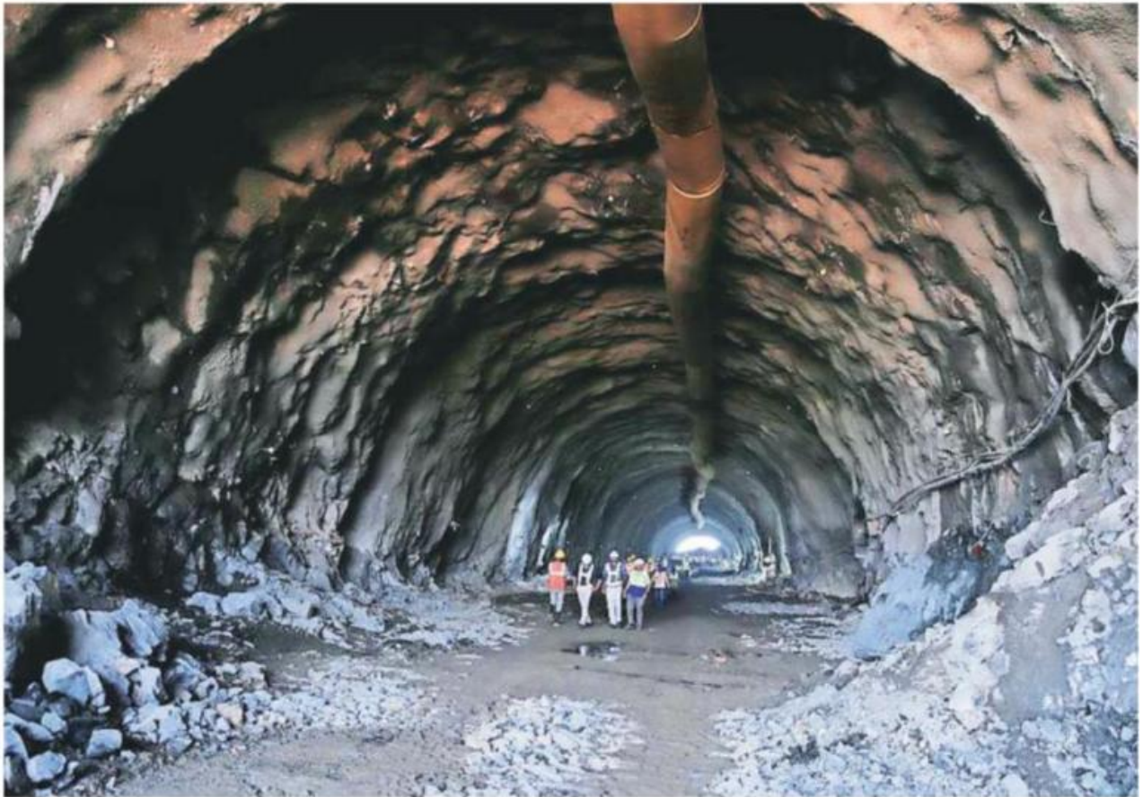
Breakthrough achieved in the first mountain tunnel of Mumbai-Ahmedabad High Speed Rail Corridor project, at Valsad in south Gujarat on Thursday.