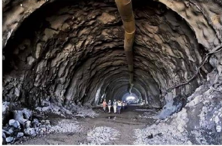
माउंटेन टनल की मुख्य विशेषताएं

अहमदाबाद-मुंबई हाई स्पीड रेल कॉरिडोर के लिए पहली माउंटेन टनल का निर्माण पूरा कर लिया गया है। हाई स्पीड रेल प्रबंधन ने इसे माइल स्टोन बताया है। यह टनल वडोदरा-सूरत-वापी सेक्शन के पैकेज सी 4 में आती है। नेशनल हाई स्पीड रेल कॉर्पोरेशन लिमिटेड ने गुरुवार को बताया कि मुंबई-अहमदाबाद हाई स्पीड रेल कॉरिडोर परियोजना के लिए माउंटेन टनल का निर्माण पूरा कर लिया गया है। यह इस रूट की पहली माउंटेन टनल है, जिसका निर्माण 10 महीने में पूरा किया गया है। यह माउंटेन टनल, गुजरात के वलसाड जिले के उम्बर गांव तालुका के जारोली गांव से लगभग 1 किमी दूर स्थित है। टनल की संरचना में टनल, पोर्टल और टनल एंट्रेस हुड जैसी अन्य कनेक्टिंग संरचनाएं शामिल हैं। टनल सिंगल ट्यूब हॉर्स-शू के आकार की है। टनल न्यू ऑस्ट्रियन टनलिंग मेथड (एनएटीएम) से बनाई जा रही है।