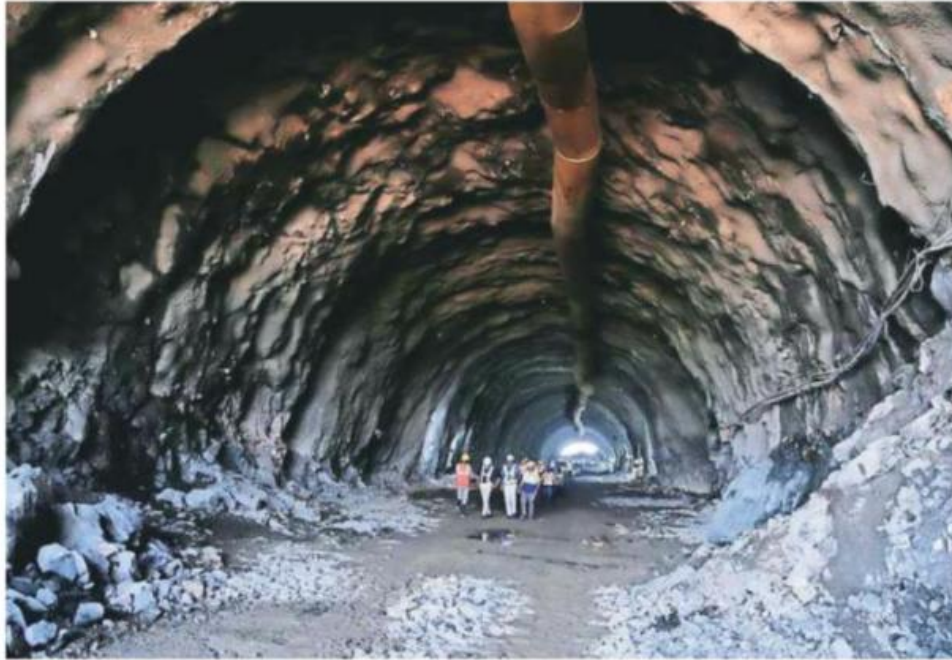
The breakthrough of the first mountain tunnel of the Mumbai-Ahmedabad High Speed Rail Corridor at Valsad in South Gujarat on Thursday.