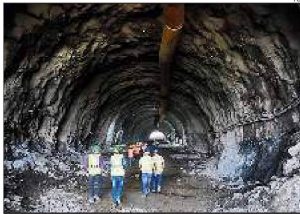
The 350-metre long tunnel has a diameter of 12.6 metres

The Mumbai-Ahmedabad high speed rail corridor will have seven mountain tunnels, all of which will be constructed using the the