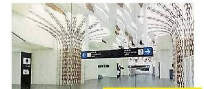
स्टेशन के अंदर का नजारा

वडोदरा स्टेशन: इस स्टेशन का बाहरी हिस्सा बरगद के पेड़ की तरह से डिजाइन किया जा रहा है।