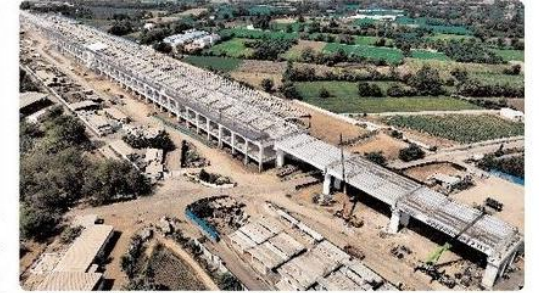
आणंद का निर्माणाधीन बुलेट ट्रेन स्टेशन।

अलग-अलग पिकअप व ड्रॉप ऑफ क्षेत्रों से निजी और सार्वजनिक परिवहन वाहनों के लिए पिक-अप एवं ड्रॉप ऑफ समय कम होगा।