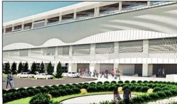
An artist's impression of Anand bullet train station

On Friday, officials of the National High Speed Rail Corporation Limited (NHSRCL) said that the station façade and the interior design of the Anand bullet train station is