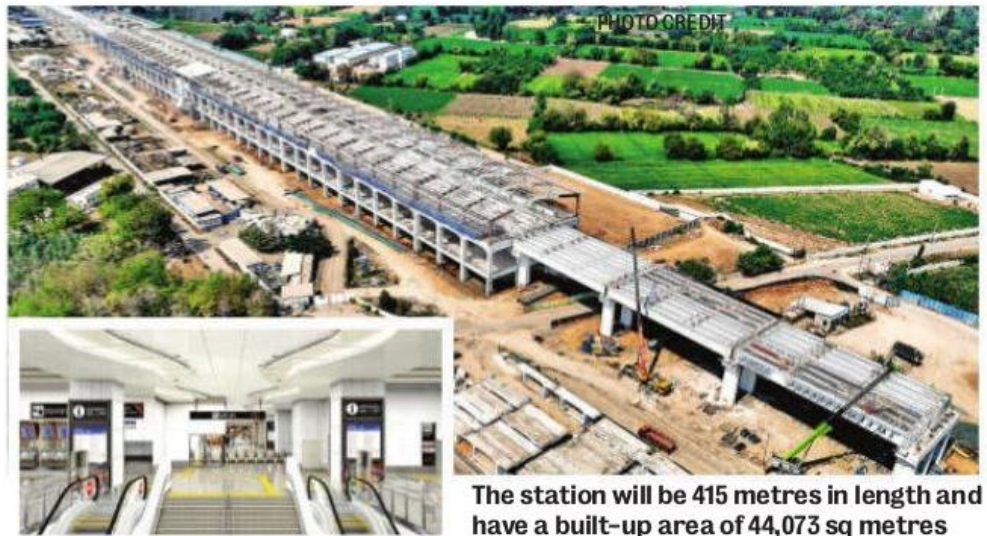
The station will be 415 metres in length and have a built-up area of 44,073 sq metres

The station with three floors will have two side platforms and four tracks in between. It will be equipped with all modern and advanced facilities including waiting areas, a business-class lounge, a nursery etc. In addition to the existing connec-