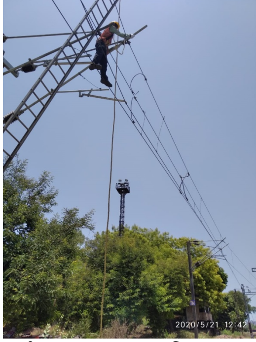
છબી 1: અમદાવાદમાં સુવધા સ્થળાંતરણ કાર્ય