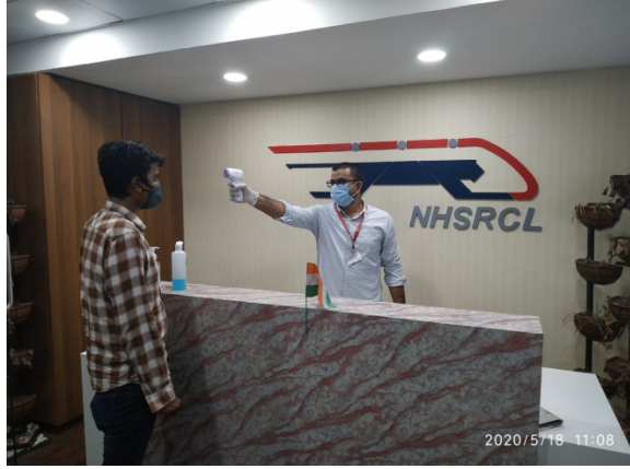
છબી 5: એનએચએસઆરસીએલ ઓફિસ પર થર્મલ સ્ક્રીનિંગ