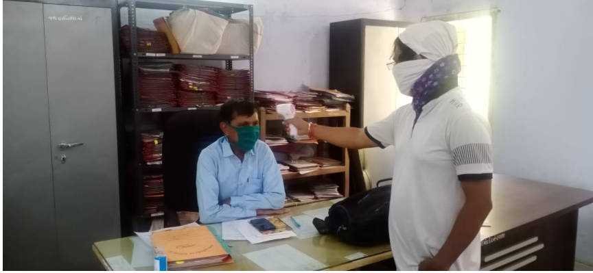
છબી 7: વડોદરા જિલ્લામાં આવેલી અમારી એક ઓફિસ પર થર્મલ સ્ક્રીનિંગ