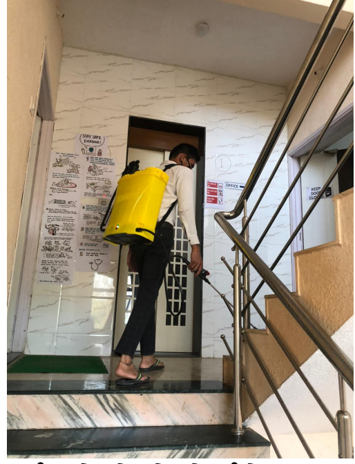
છબી 2: એનએચએસઆરસીએલ પાલઘર ઓફિસ પર પ્રગતિમાં ઓફિસ સેન્ટિશન કાર્ય