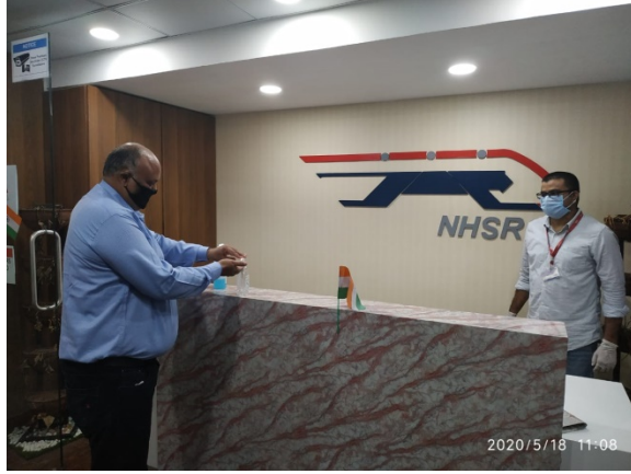
છબી 3: ઓફિસનાં પ્રવેશદ્વારો પર સેન્ટિઇઝરો રાખવામાં આવ્યા છે