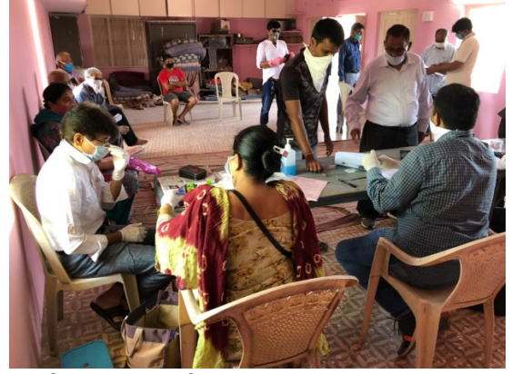
છબી 6: સુરત જિલ્લાનાં મુલાડ ગામમાં હાથ ધરવામાં આવી રહેલો સંમતકેમ્પ